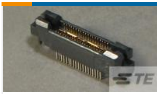
TE 系列/零件编号5767006-1 MICT,R/APLUG,38,ASSY,.025,.062