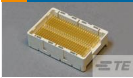
TE 系列/零件编号 6-2007614-0 STEP-Z PLUG 10MM 200P LF HT