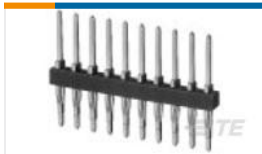
TE 系列/零件编号5-146291-3 03 MODII HDR SRST B/A 100 W/HD