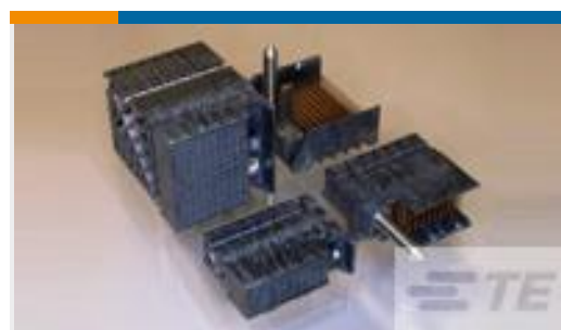
TE 系列/零件编号2132536-3 IMP100S,H,V3P6C,UG,DEW46,5,5