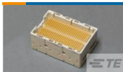
TE 系列/零件编号 6-1761614-5 STEP-Z PLUG 15MM 200P LF ST