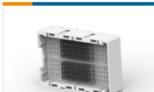
TE 系列/零件编号 3-1761614-1 STEP-Z PLUG 10MM 200/104P PB S