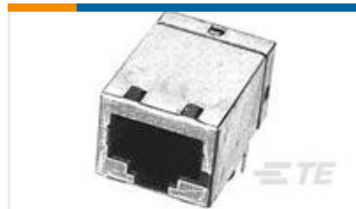
TE 系列/零件编号1734580-3 MOD-JacK,RJ45, 8P8C, SHD LP, 30u" Au