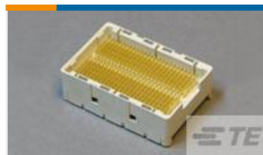
TE 系列/零件编号 6-1761614-2 STEP-Z PLUG 12MM 200P LF ST