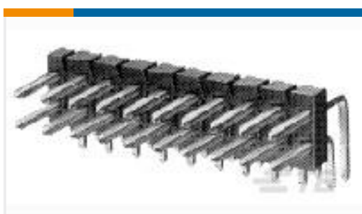
TE 系列/零件编号5-146311-8 16 MODII HDR DRRA B/A 100 W/HD