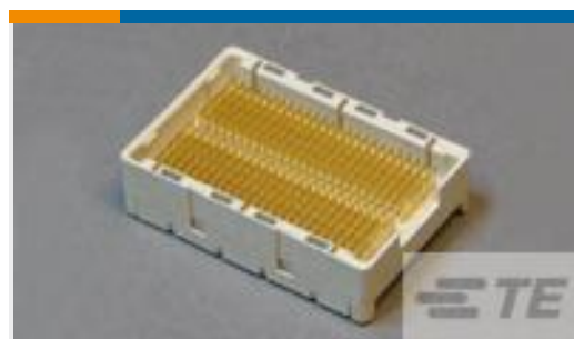
TE 系列/零件编号 6-1761614-0 STEP-Z PLUG 10MM 200P LF ST