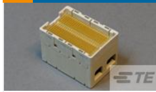
TE 系列/零件编号 7-2007614-5 STEP-Z PLUG 25MM 200P LF HT