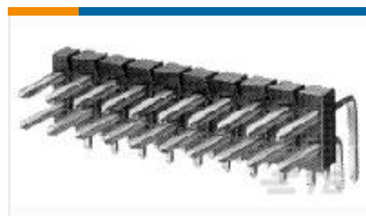
TE 系列/零件编号5-146309-8 16 MODII HDR DRRA B/A .100CL