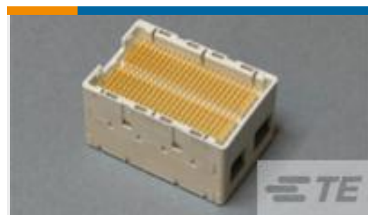
TE 系列/零件编号 7-1761614-0 STEP-Z PLUG 20MM 200P LF ST