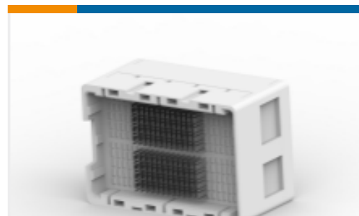
TE 系列/零件编号 3-1761614-2 STEP-Z PLUG 20MM 200/104P PB S