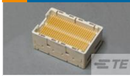
TE 系列/零件编号 6-2007614-5 STEP-Z PLUG 15MM 200P LF HT