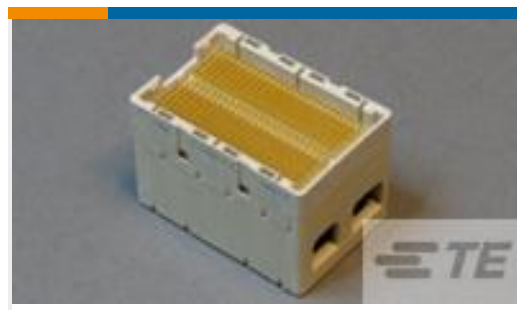
TE 系列/零件编号 7-1761614-5 STEP-Z PLUG 25MM 200P LF ST