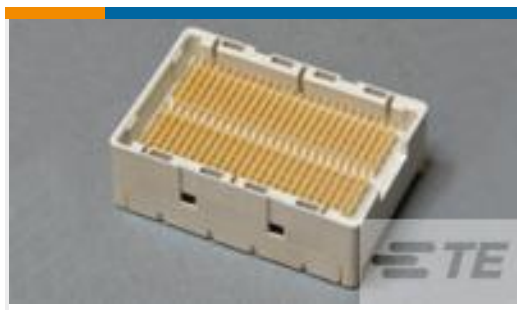
TE 系列/零件编号 6-1761614-3 STEP-Z PLUG 13MM 200P LF ST