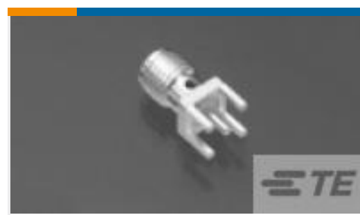
TE 系列/零件编号221789-1 JACK,PCB,SERIES SMA