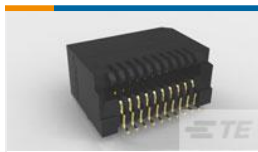
TE 系列/零件编号1888247-1 20 POS SMT CONN, SFP/SFP+, 30A