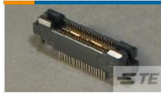
TE 系列/零件编号5767006-1 MICT,R/APLUG,38,ASSY,.025,.062