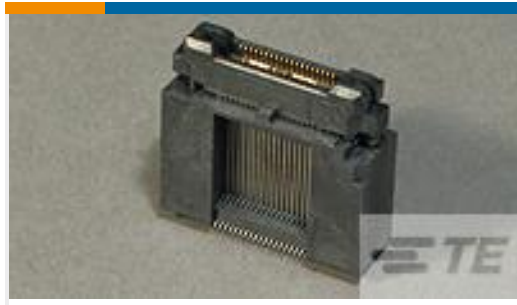
TE 系列/零件编号5767017-1 MICT,900PLUG,38,ASSY,.025,REC