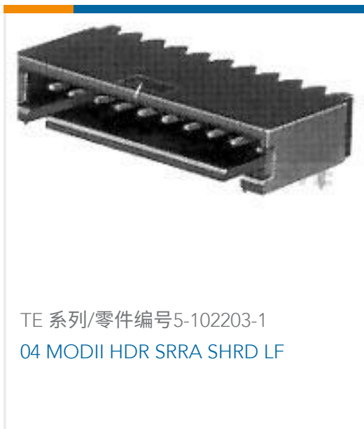
TE 系列/零件编号5-102203-1 04 MODII HDR SRRA SHRD LF