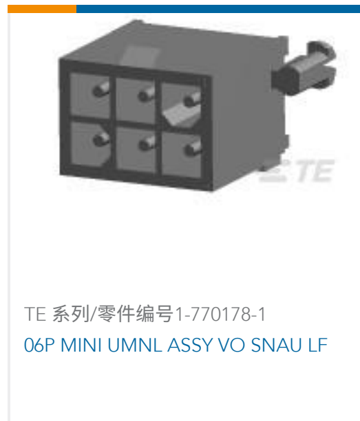
TE 系列/零件编号1-770178-1 06P MINI UMNL ASSY VO SNAU LF