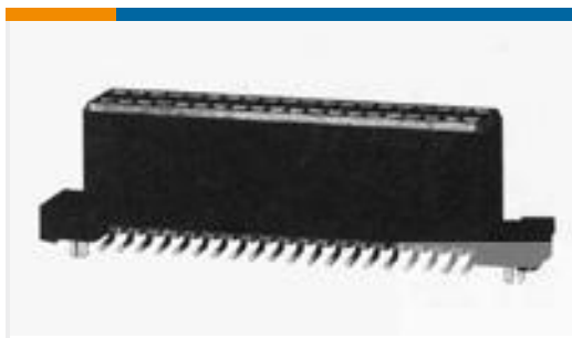
TE 系列/零件编号5-104550-7 60 SYS50 SURFMNT DRST RCPT SN