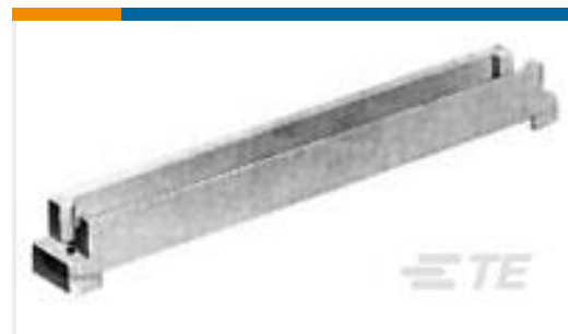
TE 系列/零件编号535074-2 EURO SHROUD 96 POS