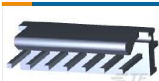
TE 系列/零件编号641126-7 07P MTA100 HDR ASY FL/STR 15AU