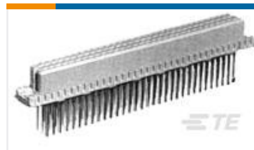
TE 系列/零件编号148059-5 096 EURO TYP C RECP 17MM ASSY