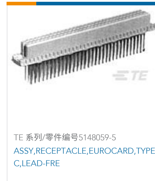
TE 系列/零件编号5148059-5 ASSY,RECEPTACLE,EUROCARD,TYPE C,LEAD-FRE