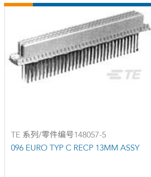
TE 系列/零件编号148057-5 096 EURO TYP C RECP 13MM ASSY