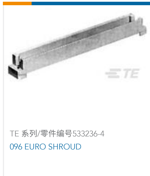
TE 系列/零件编号533236-4 096 EURO SHROUD