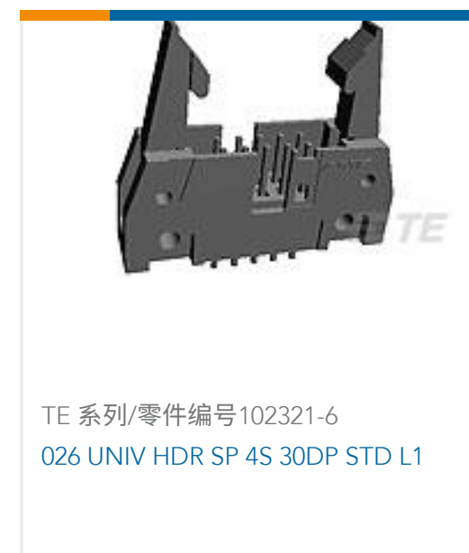
TE 系列/零件编号102321-6 026 UNIV HDR SP 4S 30DP STD L1