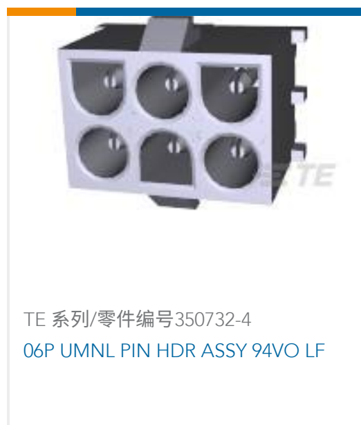
TE 系列/零件编号350732-4 06P UMNL PIN HDR ASSY 94VO LF