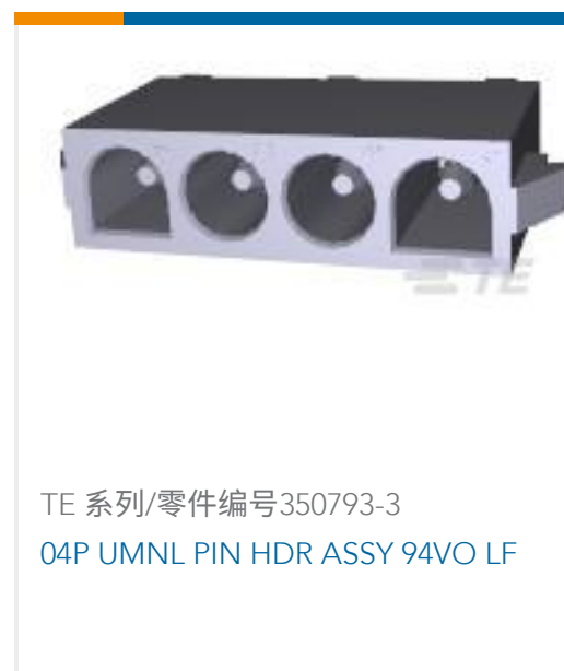
TE 系列/零件编号350793-3 04P UMNL PIN HDR ASSY 94VO LF