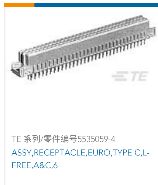
TE 系列/零件编号5535059-4 ASSY,RECEPTACLE,EURO,TYPE C,L-FREE,A&C,6