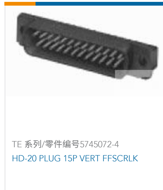
TE 系列/零件编号5745072-4 HD-20 PLUG 15P VERT FFSCRLK