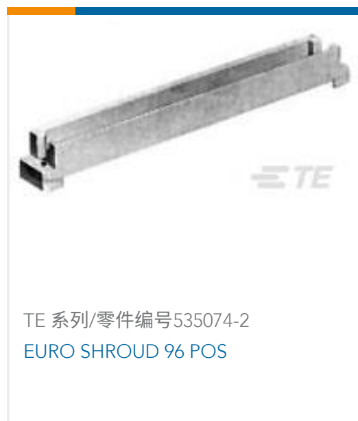
TE 系列/零件编号535074-2 EURO SHROUD 96 POS