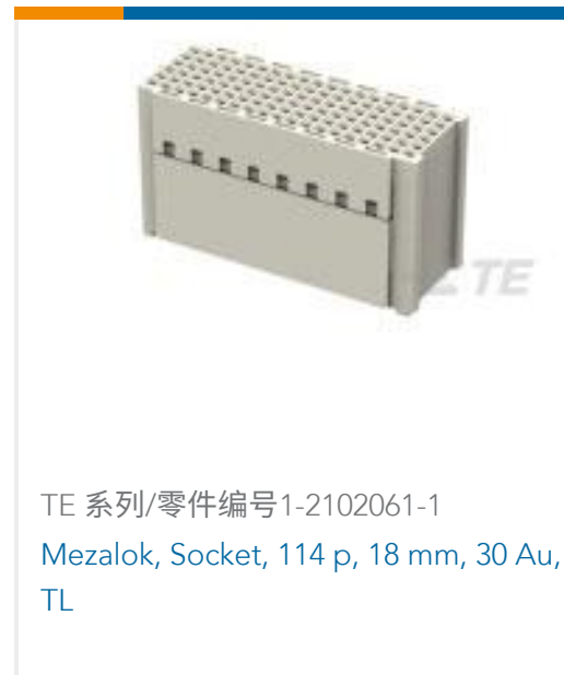
TE 系列/零件编号1-2102061-1 Mezalok, Socket, 114 p, 18 mm, 30 Au, TL