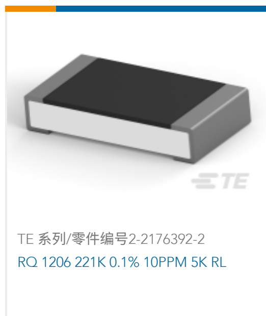
TE 系列/零件编号2-2176392-2 RQ 1206 221K 0.1% 10PPM 5K RL