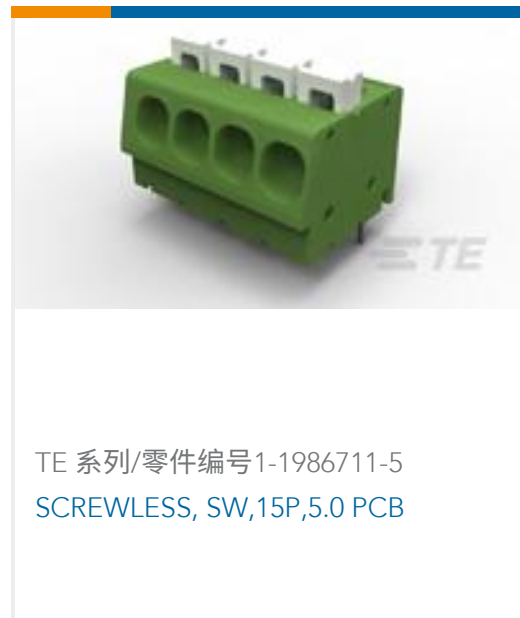
TE 系列/零件编号1-1986711-5 SCREWLESS, SW,15P,5.0 PCB