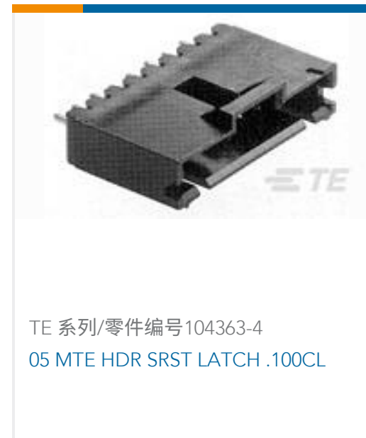
TE 系列/零件编号104363-4 05 MTE HDR SRST LATCH .100CL TL