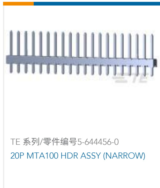
TE 系列/零件编号5-644456-0 20P MTA100 HDR ASSY (NARROW)