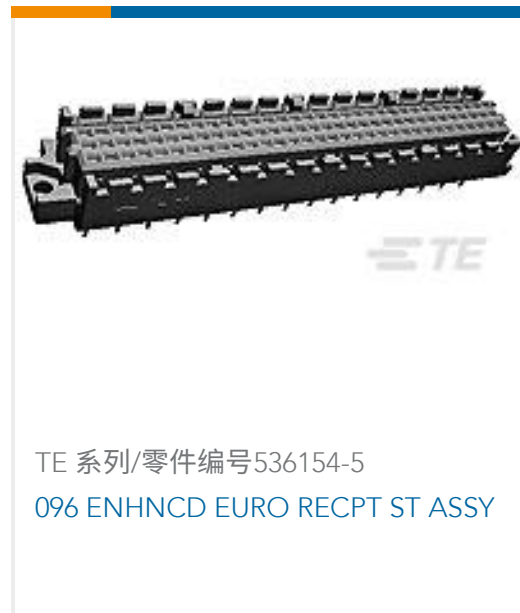
TE 系列/零件编号536154-5 096 ENHNCD EURO RECPST ST ASSY