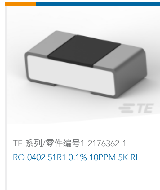
TE 系列/零件编号1-2176362-1 RQ.0402 51R1 0.1% 10PPM 5K RL