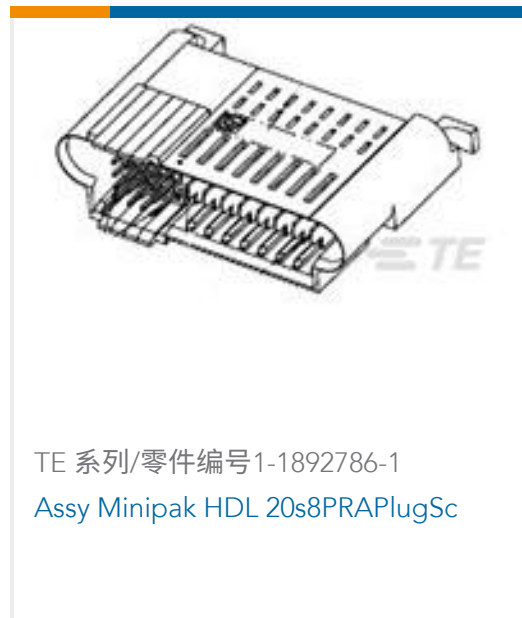
TE 系列/零件编号1-1892786-1 Assy Minipak HDL 20s8PRAPlugSc