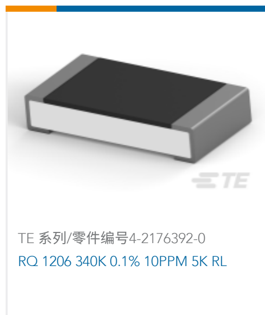
TE 系列/零件编号4-2176392-0 RQ 1206 340K 0.1% 10PPM 5K RL