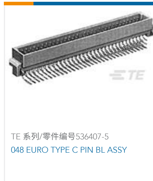
TE 系列/零件编号536407-5 048 EURO TYPE C PIN BL ASSY