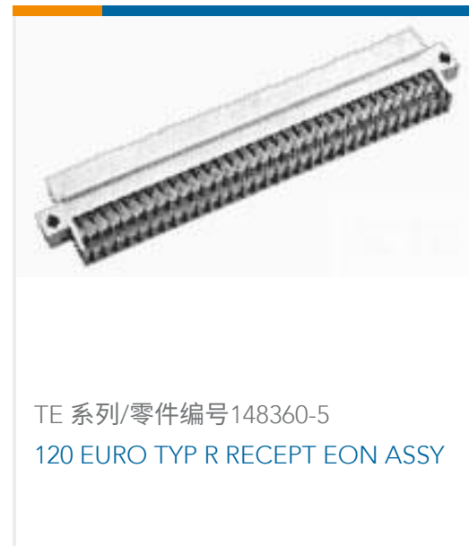
TE 系列/零件编号148360-5 120 EURO TYP R RECEPT EON ASSY