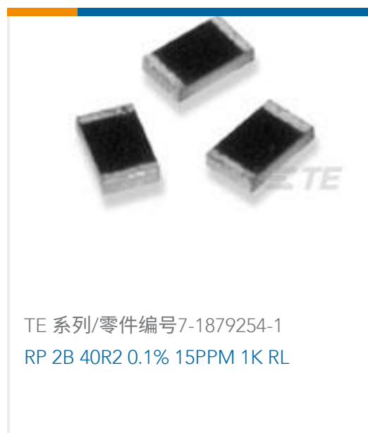
TE 系列/零件编号7-1879254-1 RP 2B 40R2 0.1% 15PPM 1K RL