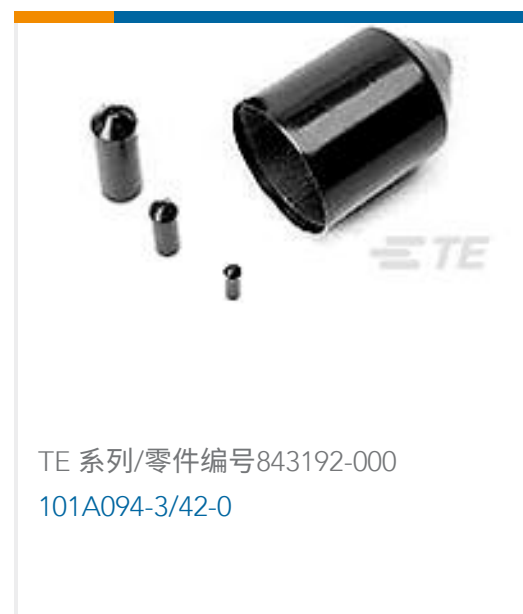
TE 系列/零件编号843192-000 101A094-3/42-0