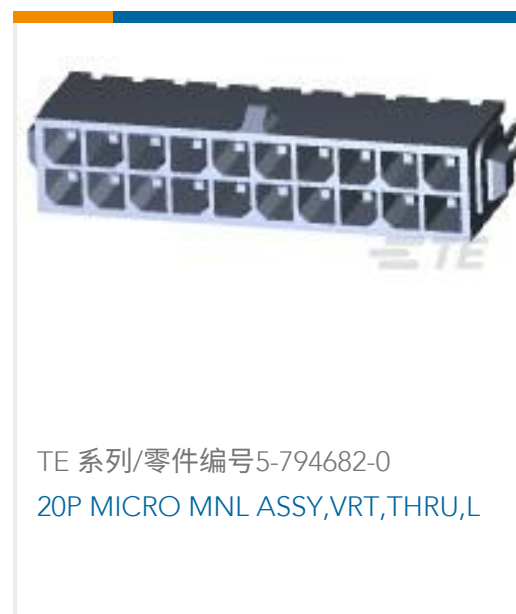
TE 系列/零件编号5-794682-0 20P MICRO MNL ASSY,VRT,THRU,L