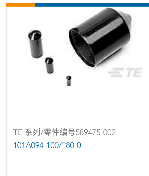
TE 系列/零件编号589475-002 101A094-100/180-0