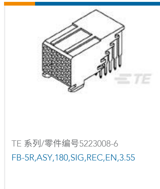
TE 系列/零件编号5223008-6 FB-5R,ASY,180,SIG,REC,EN,3.55