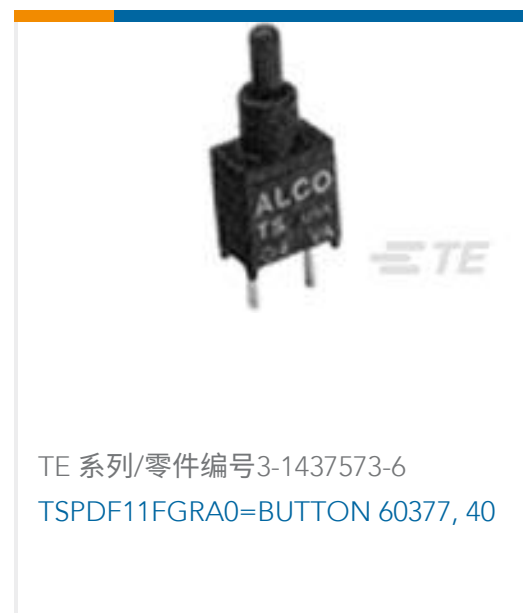
TE 系列/零件编号3-1437573-6 TSPDF11FGRA0=BUTTON 60377, 40