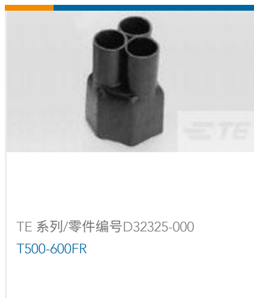
TE 系列/零件编号D32325-000 T500-600FR