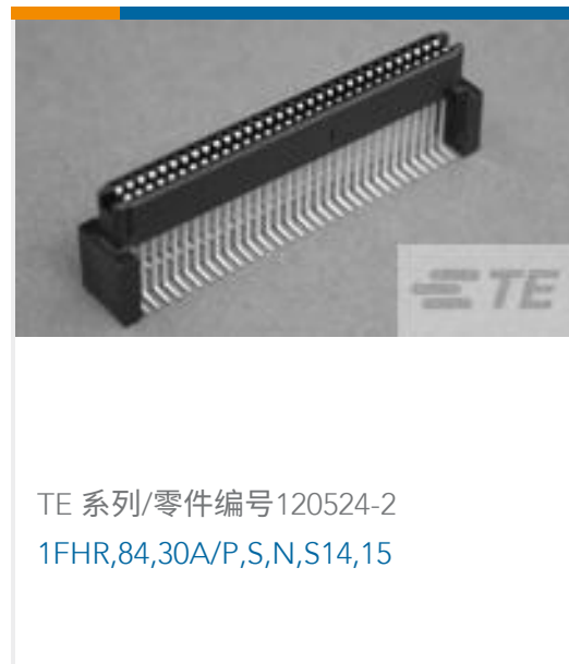
TE 系列/零件编号120524-2 1FHR,84,30A/P,S,N,S14,15