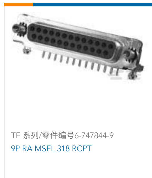
TE 系列/零件编号6-747844-9 9P RA MSFL 318 RCPT