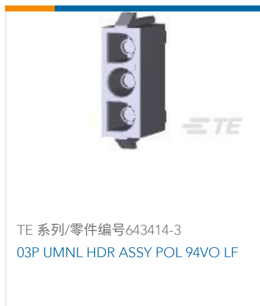
TE 系列/零件编号643414-3 03P UMNL HDR ASSY POL 94VO LF