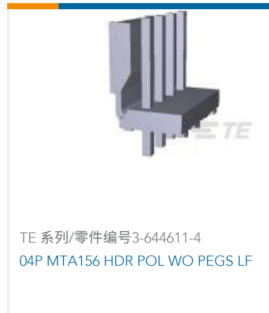
TE 系列/零件编号3-644611-4 04P MTA156 HDR POL WO PEGS LF