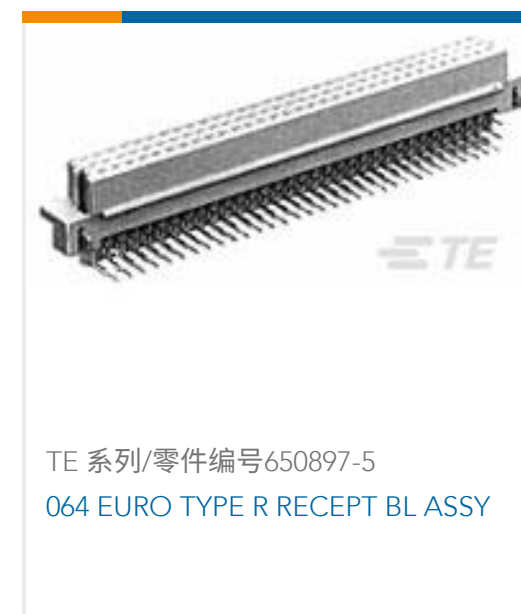
TE 系列/零件编号650897-5 064 EURO TYPE R RECEPT BL ASSY