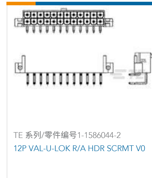
TE 系列/零件编号1-1586044-2 12P VAL-U-LOK R/A HDR SCRMT V0 AWG TPBR