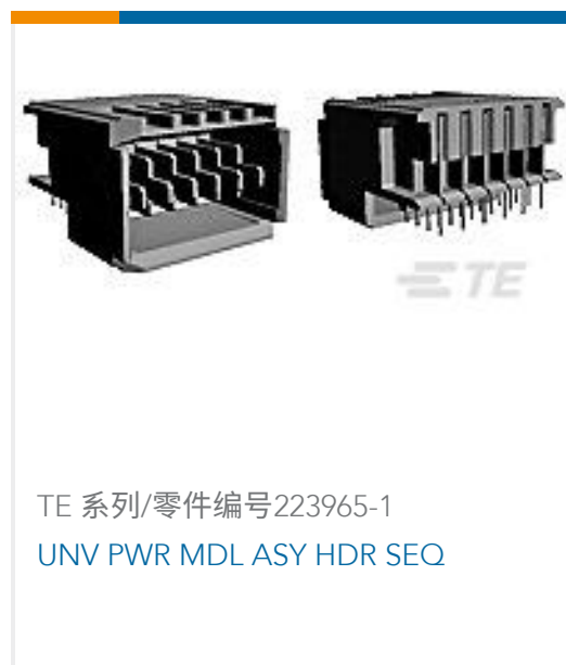
TE 系列/零件编号223965-1 UNV PWR MDL ASY HDR SEQ