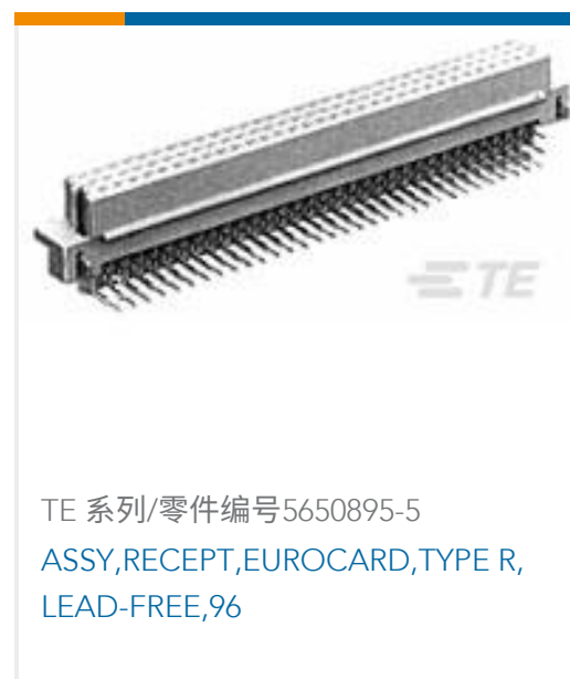
TE 系列/零件编号5650895-5 ASSY,RECEPT,EUROCARD,TYPE R, LEAD-FREE,96