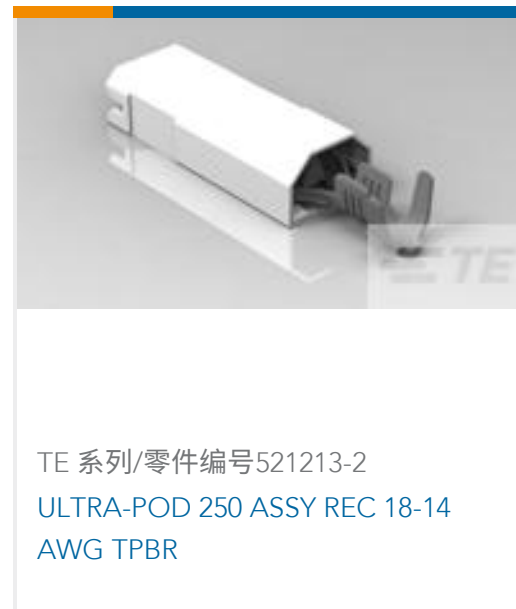
TE 系列/零件编号521213-2 ULTRA-POD 250 ASSY REC 18-14 AWG TPBR