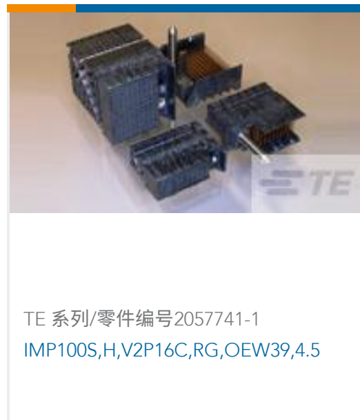
TE 系列/零件编号2057741-1 IMP100S,H,V2P16C,RG,OEW39,4.5