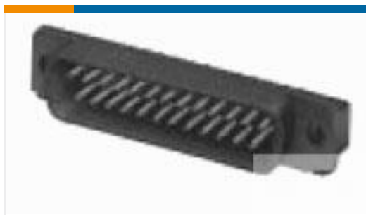
TE 系列/零件编号745051-1 09 PLUG SP/AP INSRT