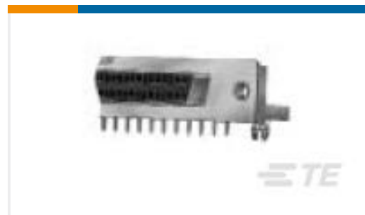
TE 系列/零件编号787170-9 100 50SR R/A RCPT, REDESIGN