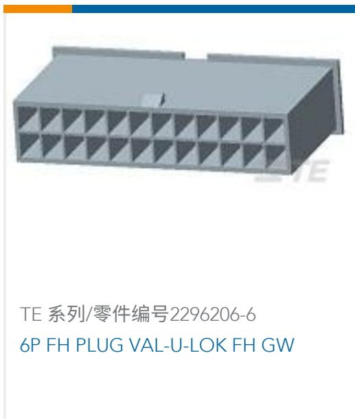
TE 系列/零件编号2296206-6 6P FH PLUG VAL-U-LOK FH GW