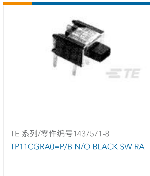
TE 系列/零件编号1437571-8 TP11CGRA0=P/B N/O BLACK SW RA