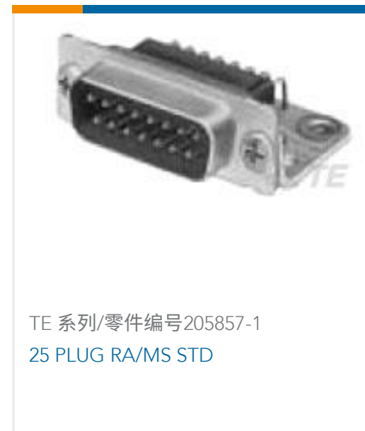
TE 系列/零件编号205857-1 25 PLUG RA/MS STD