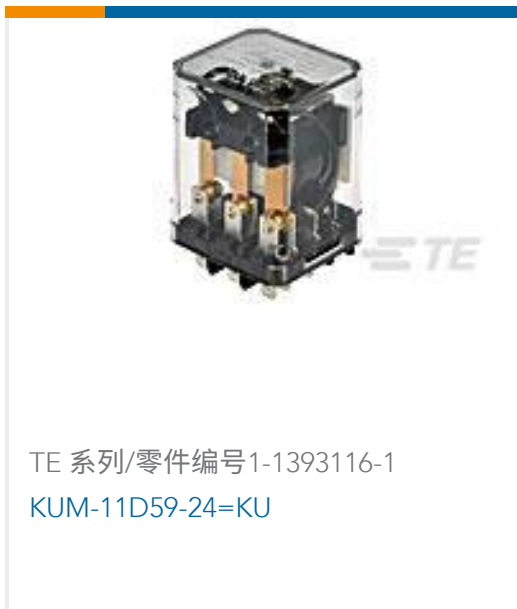
TE 系列/零件编号1-1393116-1 KUM-11D59-24=KU