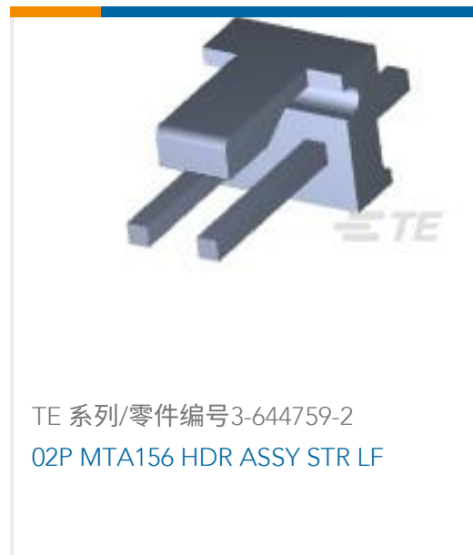
TE 系列/零件编号3-644759-2 02P MTA156 HDR ASSY STR LF