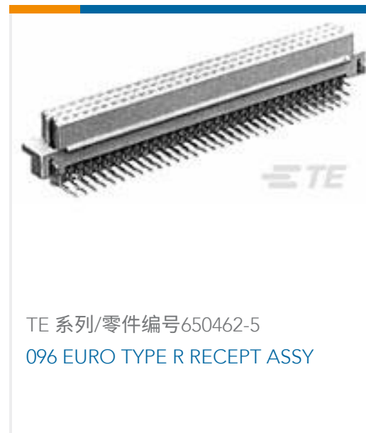
TE 系列/零件编号650462-5 096 EURO TYPE R RECEPT ASSY