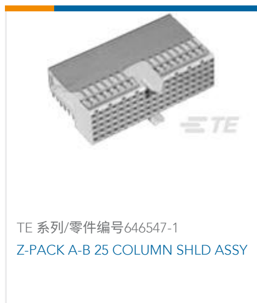
TE 系列/零件编号646547-1 Z-PACK A-B 25 COLUMN SHLD ASSY