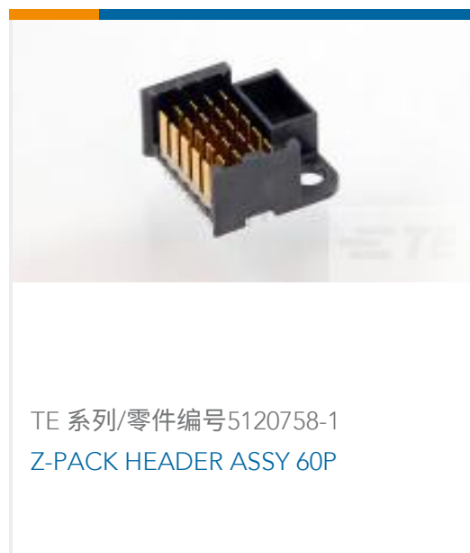
TE 系列/零件编号5120758-1 Z-PACK HEADER ASSY 60P