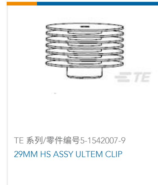
TE 系列/零件编号5-1542007-9 29MM HS ASSY ULTEM CLIP