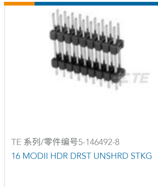
TE 系列/零件编号5-146492-8 16 MODII HDR DRST UNSHRD STKG