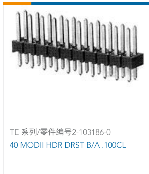
TE 系列/零件编号2-103186-0 40 MODII HDR DRST B/A .100CL