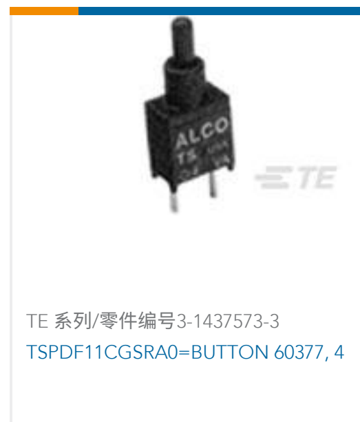
TE 系列/零件编号3-1437573-3 TSPDF11CGSRA0=BUTTON 60377, 4