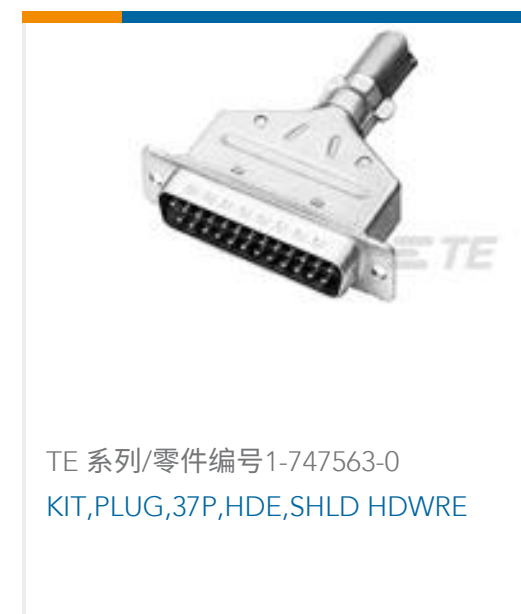
TE 系列/零件编号1-747563-0 KIT,PLUG,37P,HDE,SHLD HDWRE