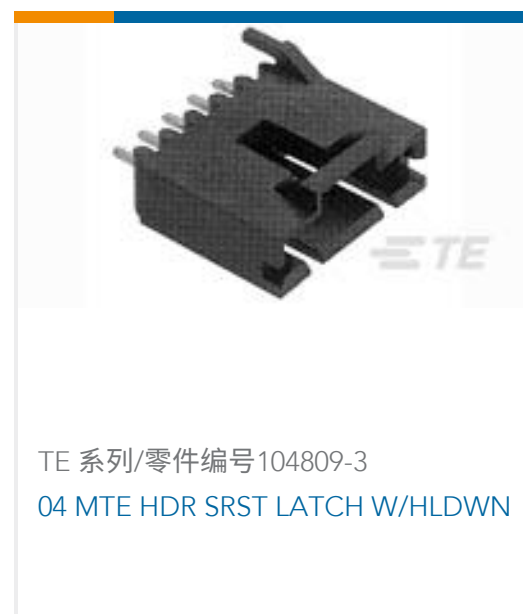
TE 系列/零件编号104809-3 04 MTE HDR SRST LATCH W/HLDWN