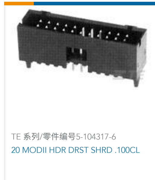
TE 系列/零件编号5-104317-6 20 MODII HDR DRST SHRD .100CL