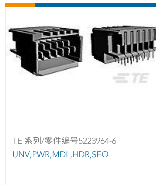
TE 系列/零件编号5223964-6 UNV,PWR,MDL,HDR,SEQ