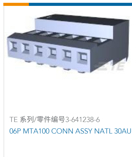
TE 系列/零件编号3-641238-6 06P MTA100 CONN ASSY NATL 30AU