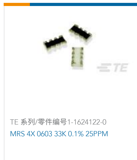
TE 系列/零件编号1-1624122-0 MRS 4X 0603 33K 0.1% 25PPM