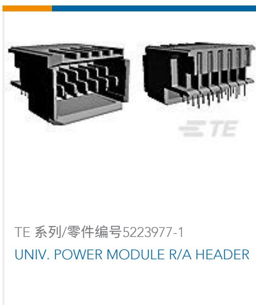
TE 系列/零件编号5223977-1 UNIV. POWER MODULE R/A HEADER