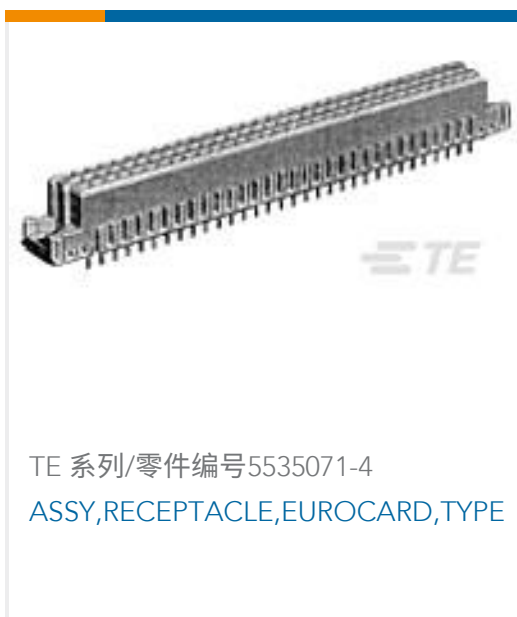
TE 系列/零件编号5535071-4 ASSY,RECEPTACLE,EUROCARD,TYPE