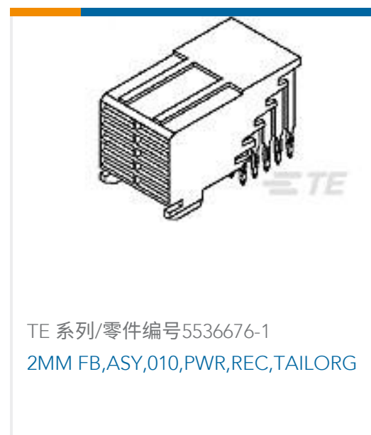
TE 系列/零件编号5536676-1 2MM FB,ASY,010,PWR,REC,TAILORG