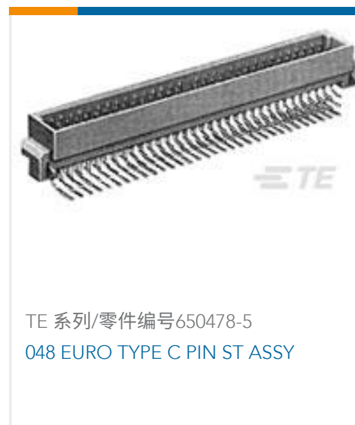
TE 系列/零件编号650478-5 048 EURO TYPE C PIN ST ASSY