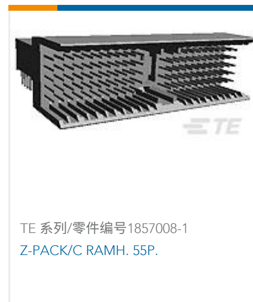
TE 系列/零件编号1857008-1 Z-PACK/C RAMH. 55P.