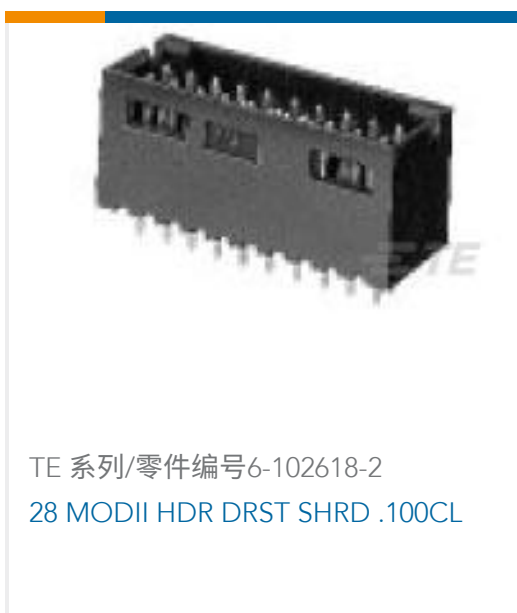
TE 系列/零件编号6-102618-2 28 MODII HDR DRST SHRD .100CL