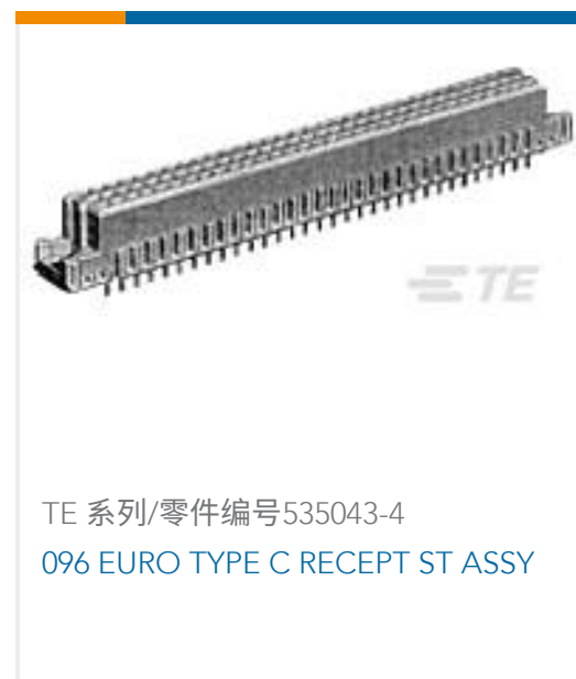
TE 系列/零件编号535043-4 096 EURO TYPE C RECEPT ST ASSY