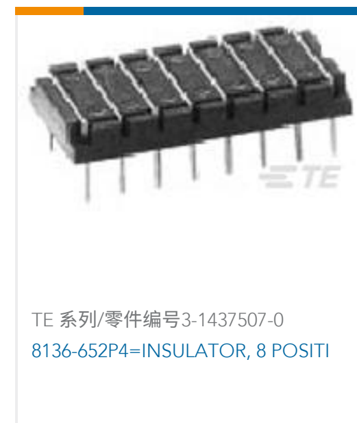
TE 系列/零件编号3-1437507-0 8136-652P4=INSULATOR, 8 POSITI