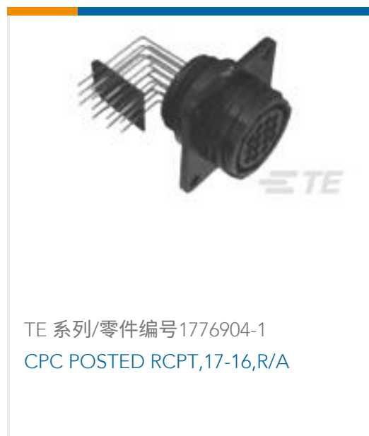
TE 系列/零件编号1776904-1 CPC POSTED RCPT,17-16,R/A