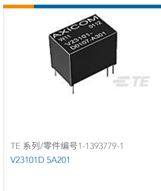
TE 系列/零件编号1-1393779-1 V23101D 5A201