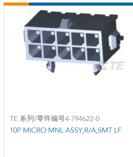
TE 系列/零件编号4-794622-0 10P MICRO MNL ASSY,R/A,SMT LF