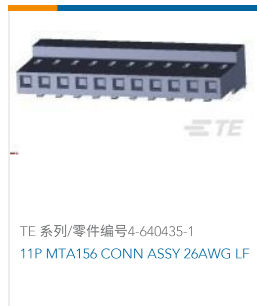
TE 系列/零件编号4-640435-1 11P MTA156 CONN ASSY 26AWG LF