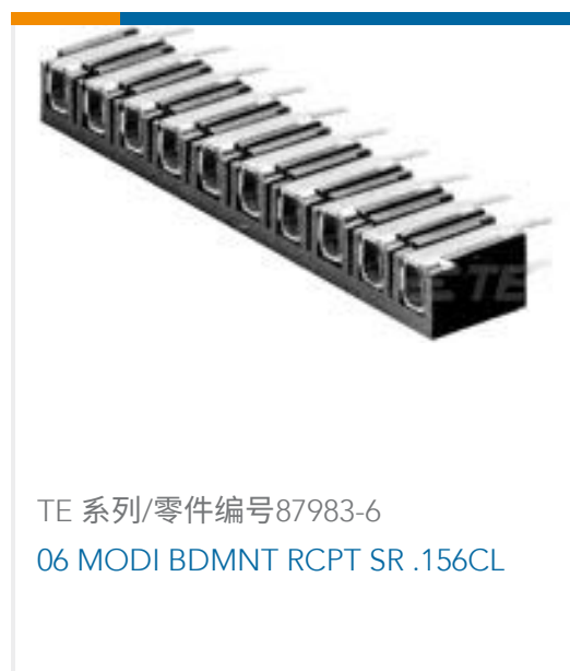
TE 系列/零件编号87983-6 06 MODI BDMNT RCPT SR .156CL