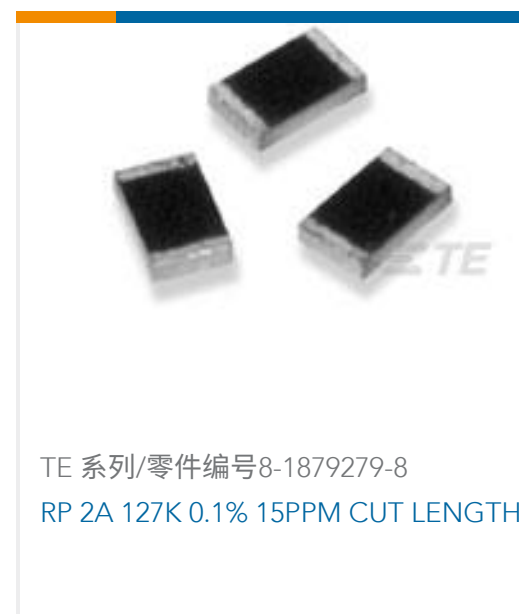
TE 系列/零件编号8-1879279-8 RP 2A 127K 0.1% 15PPM CUT LENGTH