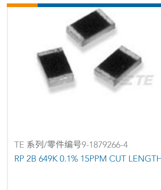
TE 系列/零件编号9-1879266-4 RP 2B 649K 0.1% 15PPM CUT LENGTH