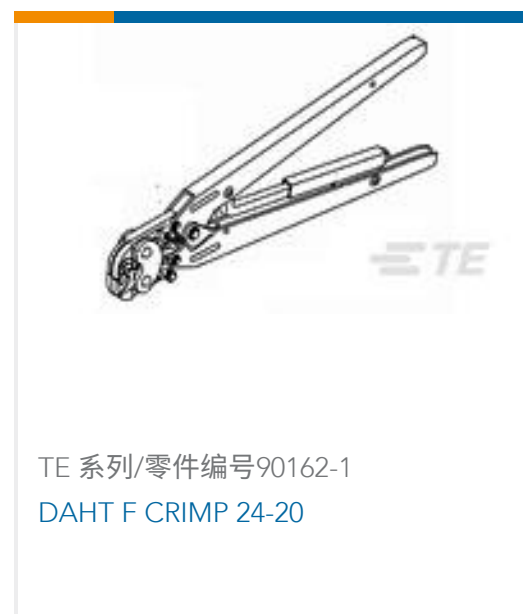
TE 系列/零件编号90162-1 DAHT F CRIMP 24-20