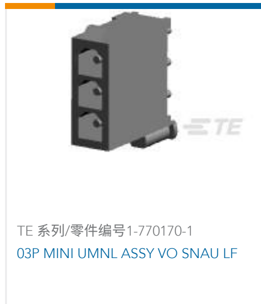
TE 系列/零件编号1-770170-1 03P MINI UMNL ASSY VO SNAU LF