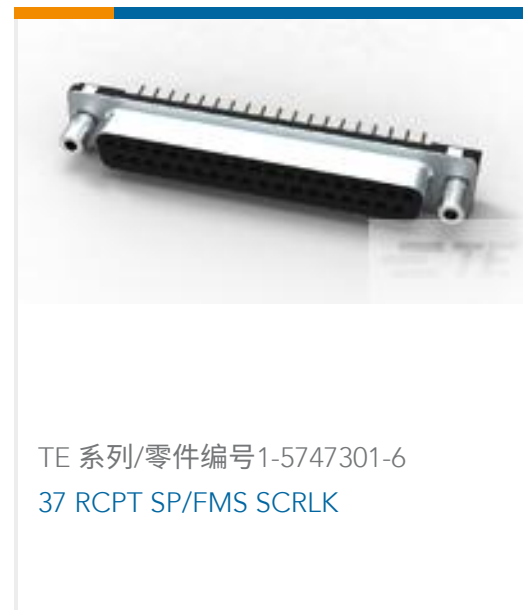
TE 系列/零件编号1-5747301-6 37 RCPT SP/FMS SCRLK