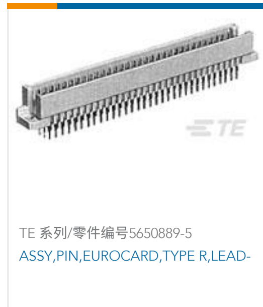
TE 系列/零件编号5650889-5 ASSY,PIN,EUROCARD,TYPE R,LEAD-