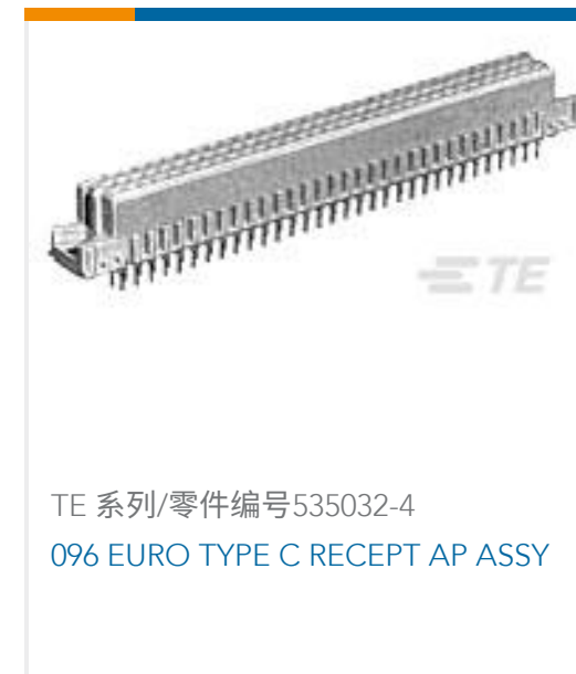
TE 系列/零件编号535032-4 096 EURO TYPE C RECEPT AP ASSY