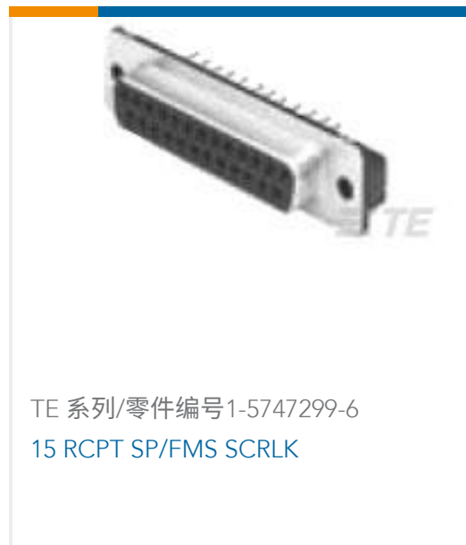
TE 系列/零件编号1-5747299-6 15 RCPT SP/FMS SCRLK