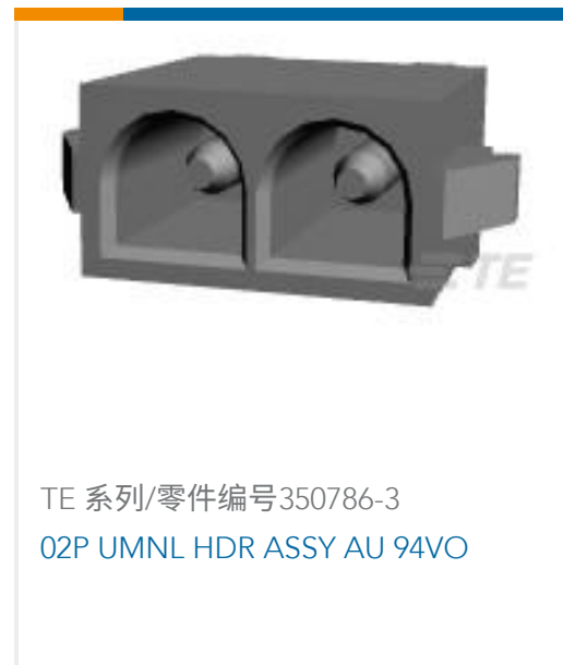
TE 系列/零件编号350786-3 02P UMNL HDR ASSY AU 94VO