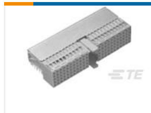
TE 系列/零件编号352068-1 Z-PACK/A F-HDR 110P