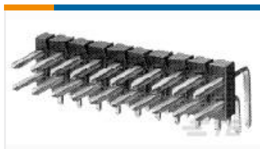
TE 系列/零件编号5-146308-3 06 MODII HDR DRRR B/A .100