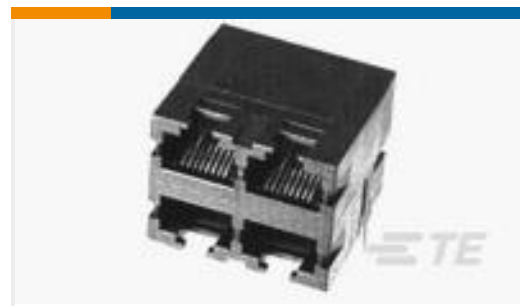
TE 系列/零件编号2041376-1 RJ45 w LED, 2x2, 6u", DIP, H=25.4mm