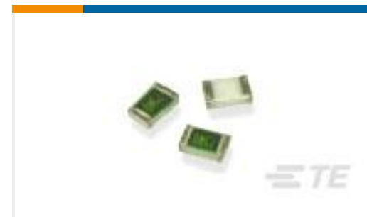
TE 系列/零件编号1676731-1 RN 0805 100R 0.1% 5PPM 1K RL