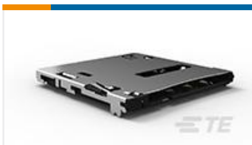
TE 系列/零件编号2174803-2 PUSH-PUSH MICRO SIM CONNECTOR