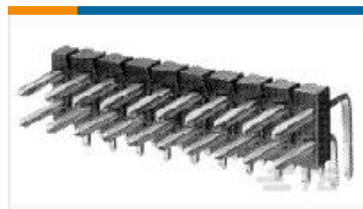
TE 系列/零件编号5-146308-3 06 MODII HDR DRRA B/A .100