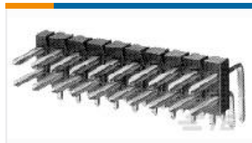
TE 系列/零件编号5-146308-3 06 MODII HDR DRRA B/A .100