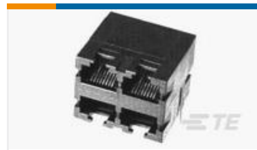
TE 系列/零件编号2041376-1 RJ45 w LED, 2x2, 6u", DIP, H=25.4mm