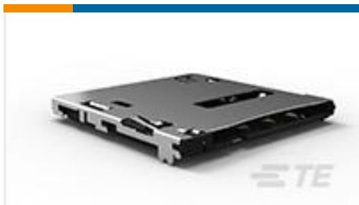
TE 系列/零件编号2174803-2 PUSH-PUSH MICRO SIM CONNECTOR