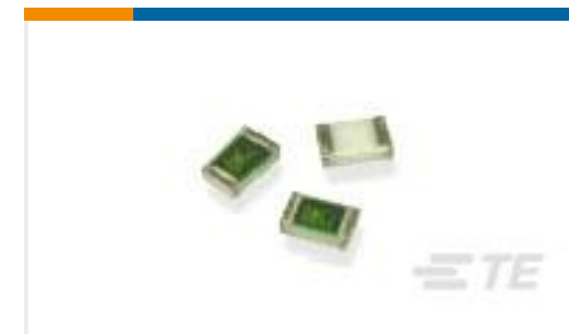
TE 系列/零件编号1676731-1 RN 0805 100R 0.1% 5PPM 1K RL