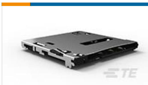
TE 系列/零件编号2174803-2 PUSH-PUSH MICRO SIM CONNECTOR