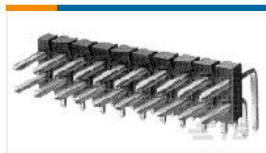
TE 系列/零件编号5-146308-3 06 MOD II HDR DRRA B/A .100