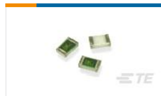
TE 系列/零件编号1676731-1 RN 0805 100R 0.1% 5PPM 1K RL