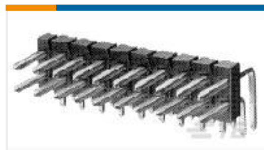
TE 系列/零件编号5-146308-3 06 MODII HDR DRRR B/A .100