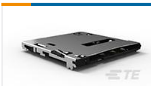
TE 系列/零件编号2174803-2 PUSH-PUSH MICRO SIM CONNECTOR