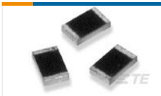
TE 系列/零件编号6-1879261-8 RP 2B 10K 0.1% 15PPM 1K RL