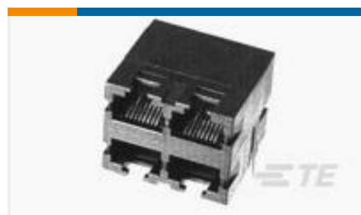
TE 系列/零件编号2041376-1 RJ45 w LED, 2x2, 6u", DIP, H=25.4mm