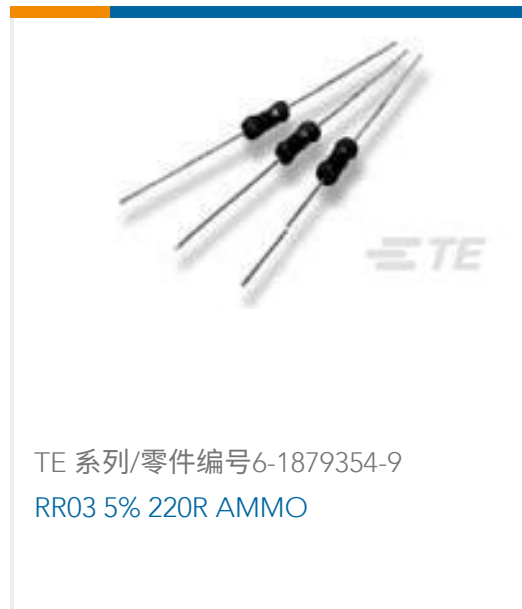
TE 系列/零件编号6-1879354-9 RR03 5% 220R AMMO