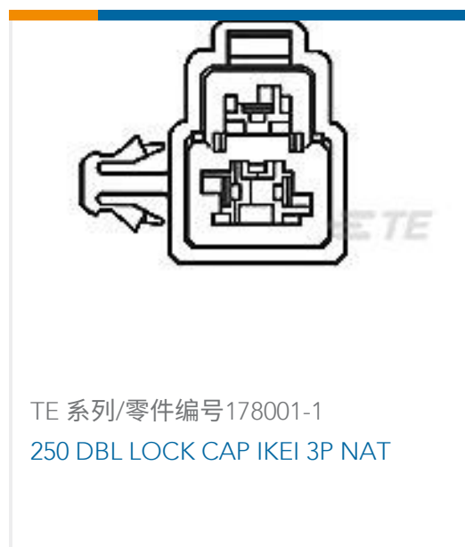
TE 系列/零件编号178001-1 250 DBL LOCK CAP IKEI 3P NAT