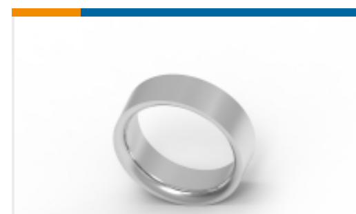
TE 系列/零件编号1-1379200-1 ALU FERRULE GDL 5G