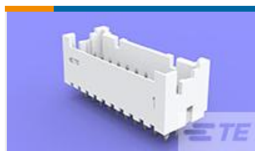
TE 系列/零件编号1969543-8 ASSY, HDR, VERT, BOSSED, DUAL ROW, EP2.5