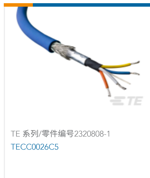
TE 系列/零件编号2320808-1 TECC0026C5