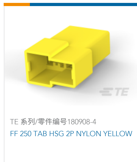
TE 系列/零件编号180908-4 FF 250 TAB HSG 2P NYLON YELLOW