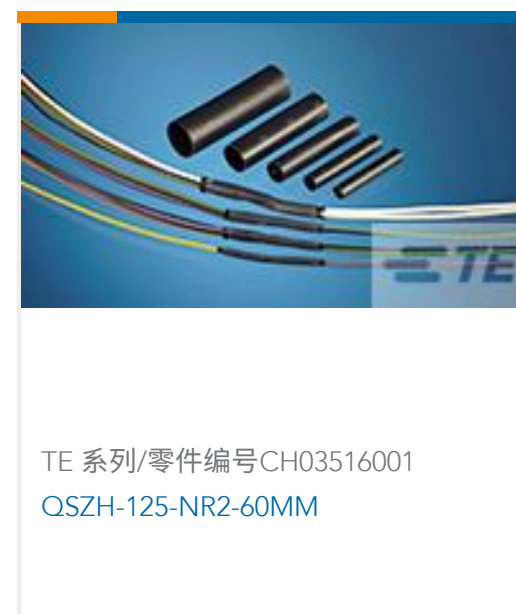
TE 系列/零件编号CH03516001 QSZH-125-NR2-60MM