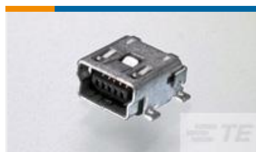
TE 系列/零件编号3-1734035-2 Mini USB,R/A,SMT,matte tin,w/o mylar