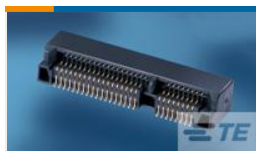
TE 系列/零件编号2041119-1 mSATA/mini PCI-E 4H Type I G/F