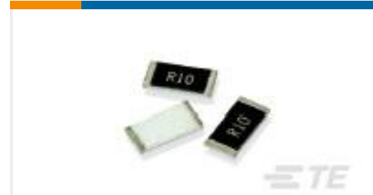
TE 系列/零件编号2176050-8 RLP73N 1E R10 5% 5K RL