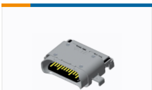
TE 系列/零件编号1-2295018-2 USB TYPE C, REC OFFSET 0.65MM DUAL SMT