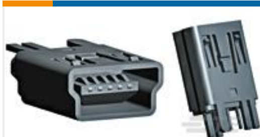
TE 系列/零件编号2041517-1 MINI USB, RCPT,V/T,DIP, B TYPE,30u" Au