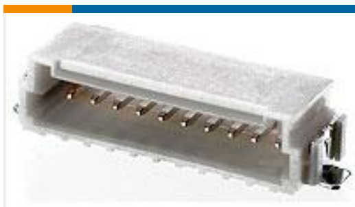
TE 系列/零件编号292228-2 1.5 MINI CT SGL H SMT W/O BOSS