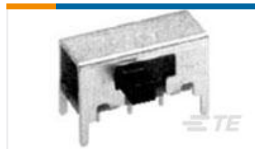
TE 系列/零件编号1825232-1 SLIDE SWITCH,SPDT,Right Angle