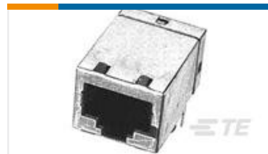
TE 系列/零件编号1-1734264-1 M/J,RJ45,Side entry,8P8C,R/A,1