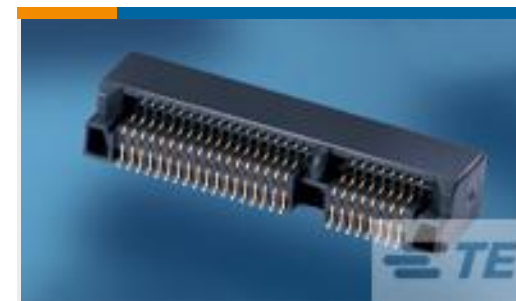
TE 系列/零件编号2041119-2 mSATA/mini PCI-E 4H Type I 10u"