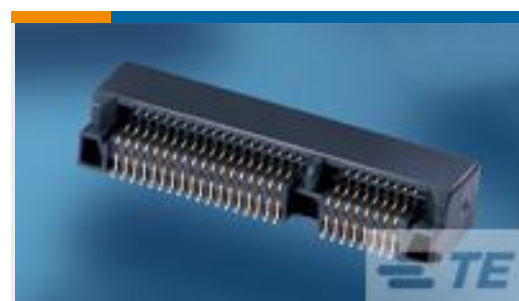
TE 系列/零件编号2041119-1 mSATA/mini PCI-E 4H Type I G/F