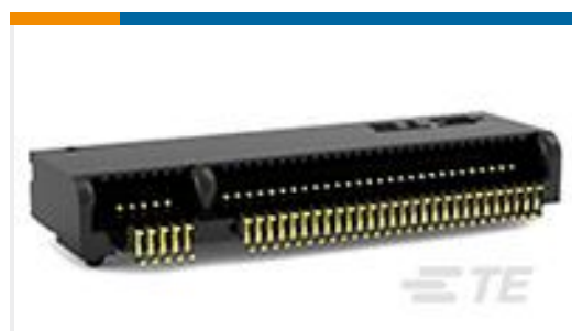
TE 系列/零件编号2199119-4 M.2 0.5PITCH 3.2H KEY E 15U" AU