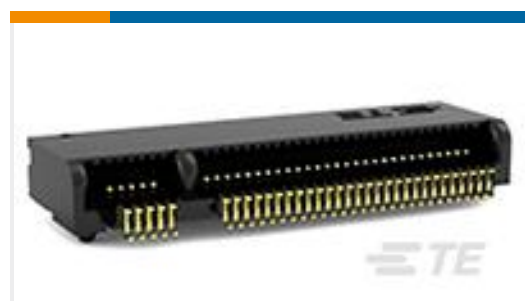
TE 系列/零件编号1-2199119-5 M.2 0.5PITCH 3.2H KEY M 15U" AU