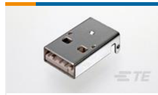
TE 系列/零件编号1734028-1 Std USB Type A, Plug, Natural