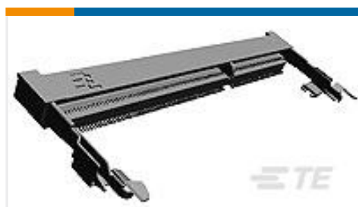
TE 系列/零件编号2-2013289-1 EMBOSS TAPE DDR3 204P 5.2H STD