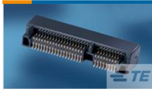
TE 系列/零件编号1775862-2 mSATA/mini PCI-E 5.2H Type I G/F