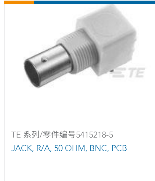
TE 系列/零件编号5415218-5 JACK, R/A, 50 OHM, BNC, PCB