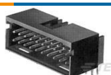
TE 系列/零件编号5-102617-3 10 MODII HDR DRRRA SHRD LF