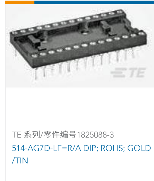
TE 系列/零件编号1825088-3 514-AG7D-LF=R/A DIP; ROHS; GOLD /TIN