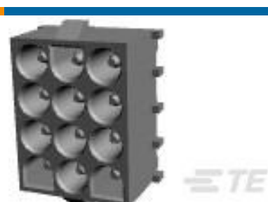
TE 系列/零件编号350713-4 12P UMNL PIN HDR ASSY 94VO LF