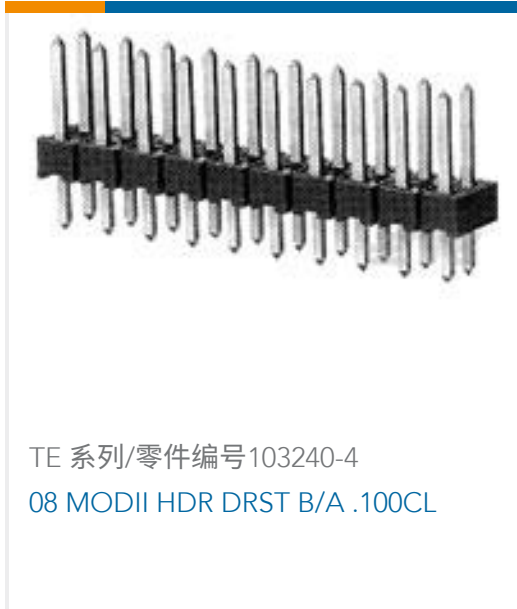
TE 系列/零件编号103240-4 08 MODII HDR DRST B/A .100CL