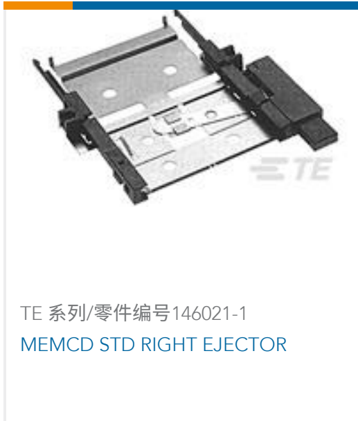
TE 系列/零件编号146021-1 MEMCD STD RIGHT EJECTOR