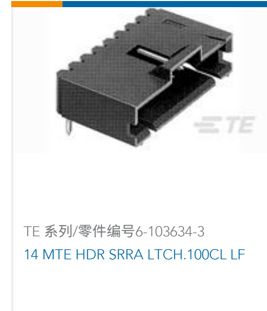
TE 系列/零件编号6-103634-3 14 MTE HDR SRRA LTCH.100CL LF