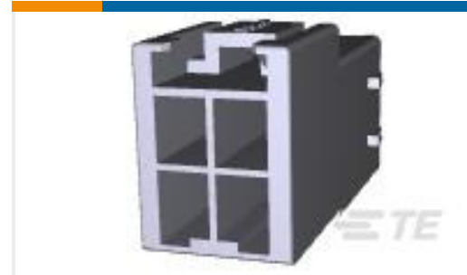
TE 系列/零件编号368587-1 PDL 4P CAP 3.96 D/R F/H(GWT) N