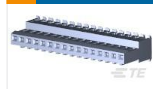
TE 系列/零件编号4-640622-6 16P MTA100 FD THRU ASSY BLUE