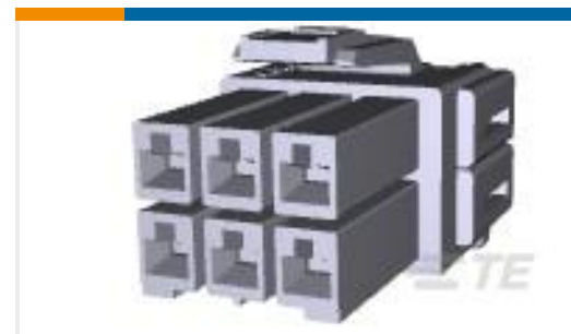
TE 系列/零件编号177901-2 POWER DBL LOCK CONN PLUG 6P