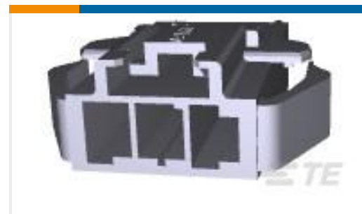
TE 系列/零件编号177907-9 DBL LOCK CAP P/M 3P BLACK