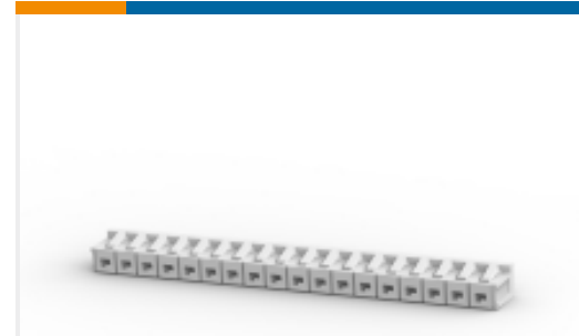
TE 系列/零件编号1-172520-8 LOW PRO MINI AMP-IN HDR 18P