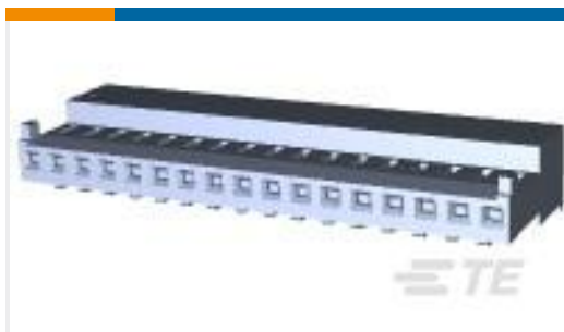
TE 系列/零件编号4-643815-7 17P MTA100 CONN ASSY POL RIB