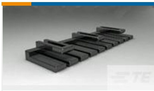
TE 系列/零件编号1-1969443-2 EP 2.5 TPA Retainer, 12 Pos