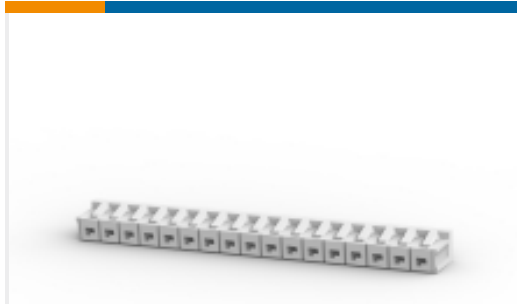
TE 系列/零件编号1-172520-7 LOW PRO MINI AMP-IN HDR 17P