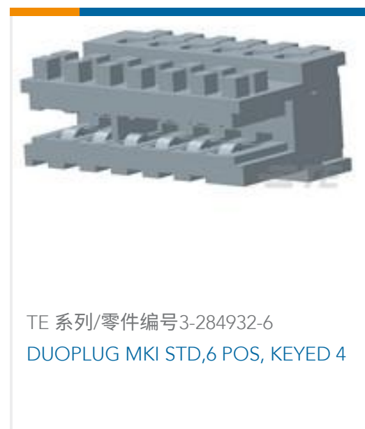
TE 系列/零件编号3-284932-6 DUOPLUG MKI STD,6 POS, KEYED 4