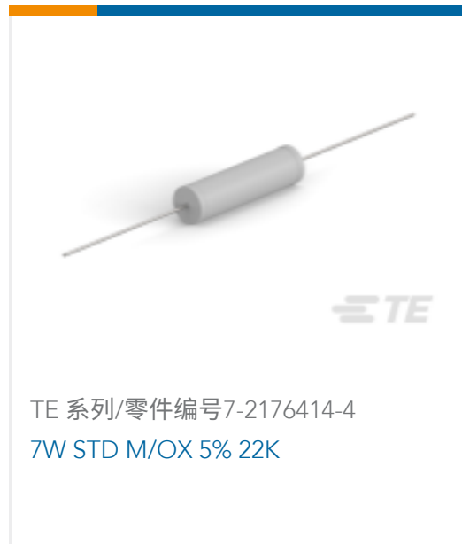
TE 系列/零件编号7-2176414-4 7W STD M/OX 5% 22K