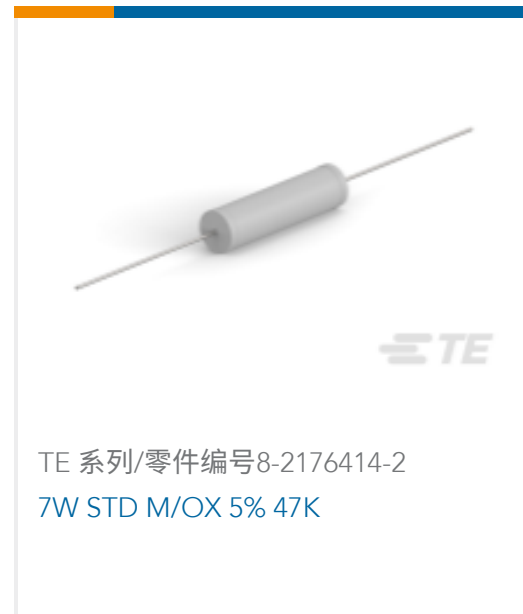
TE 系列/零件编号8-2176414-2 7W STD M/OX 5% 47K