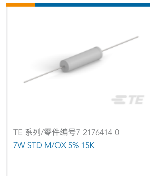
TE 系列/零件编号7-2176414-0 7W STD M/OX 5% 15K