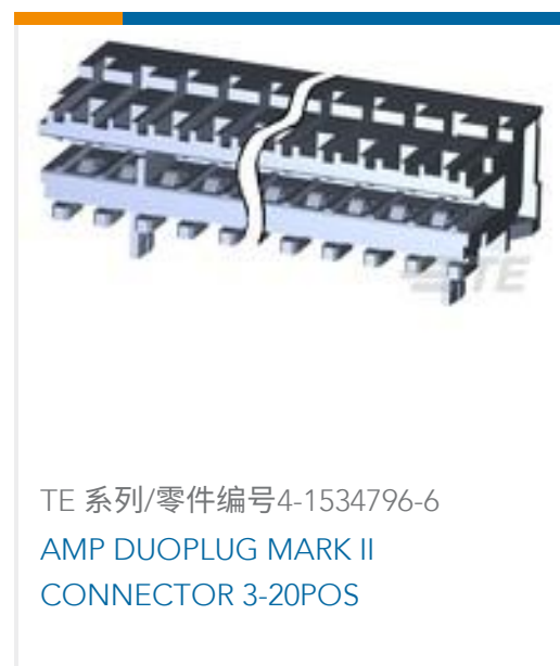
TE 系列/零件编号4-1534796-6 AMP DUOPLUG MARK II CONNECTOR 3-20POS