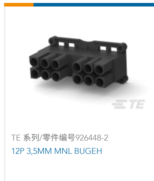
TE 系列/零件编号926448-2 12P 3,5MM MNL BUGEH