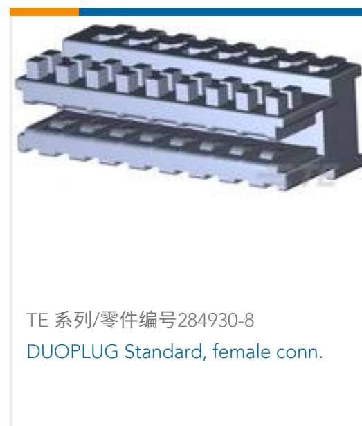
TE 系列/零件编号284930-8 DUOPLUG Standard, female conn.