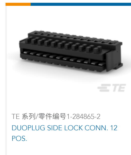
TE 系列/零件编号1-284865-2 DUOPLUG SIDE LOCK CONN. 12 POS.