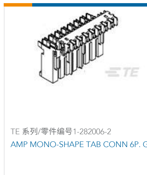
TE 系列/零件编号1-282006-2 AMP MONO-SHAPE TAB CONN 6P. G