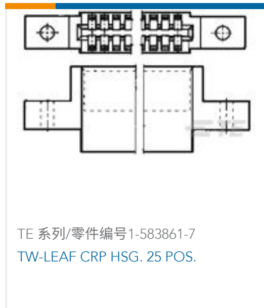
TE 系列/零件编号1-583861-7 TW-LEAF CRP HSG. 25 POS.