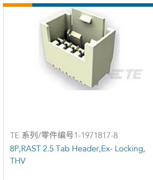
TE 系列/零件编号1-1971817-8 8P,RAST 2.5 Tab Header,Ex- Locking, THV