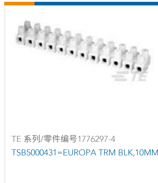
TE 系列/零件编号1776297-4 TSB5000431=EUROPA TRM BLK,10MM