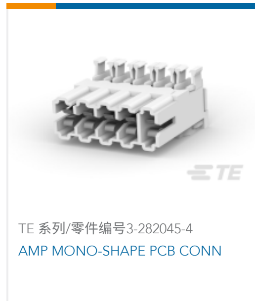
TE 系列/零件编号3-282045-4 AMP MONO-SHAPE PCB CONN