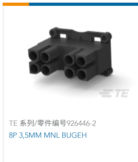
TE 系列/零件编号926446-2 8P 3,5MM MNL BUGEH