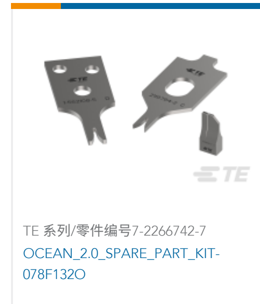
TE 系列/零件编号7-2266742-7 OCEAN_2.0_SPARE_PART_KIT- 078F132O