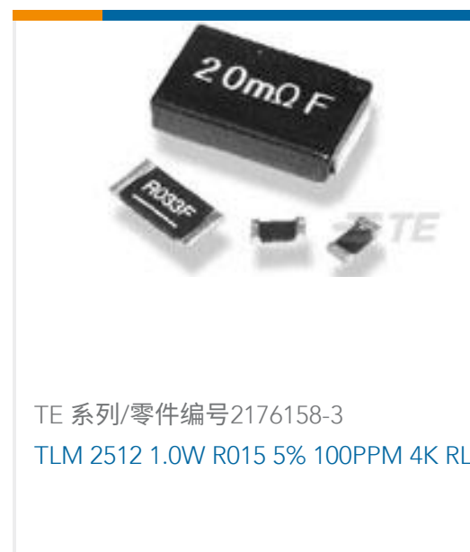
TE 系列/零件编号2176158-3 TLM 2512 1.0W R015 5% 100PPM 4K RL