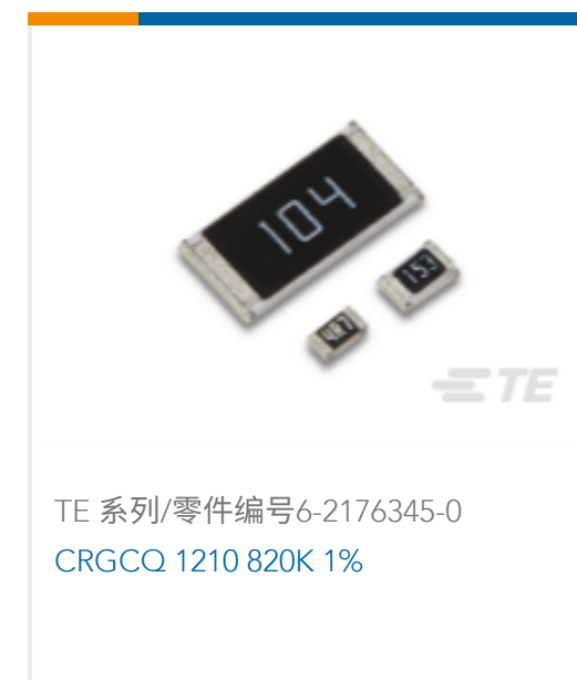
TE 系列/零件编号6-2176345-0 CRGCO 1210 820K 1%