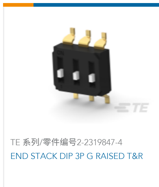
TE 系列/零件编号2-2319847-4 END STACK DIP 3P G RAISED T&R