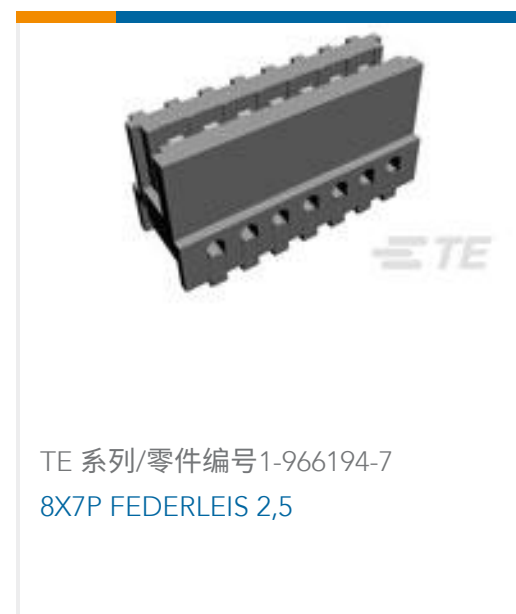
TE 系列/零件编号1-966194-7 8X7P FEDERLEIS 2,5