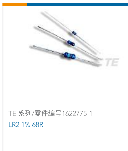
TE 系列/零件编号1622775-1 LR2 1% 68R