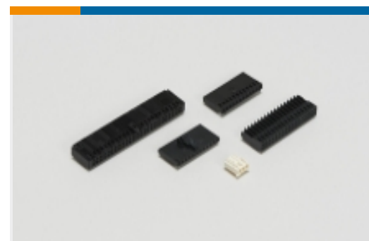
Wire-to-Board Connector Assemblies & Housings(216)