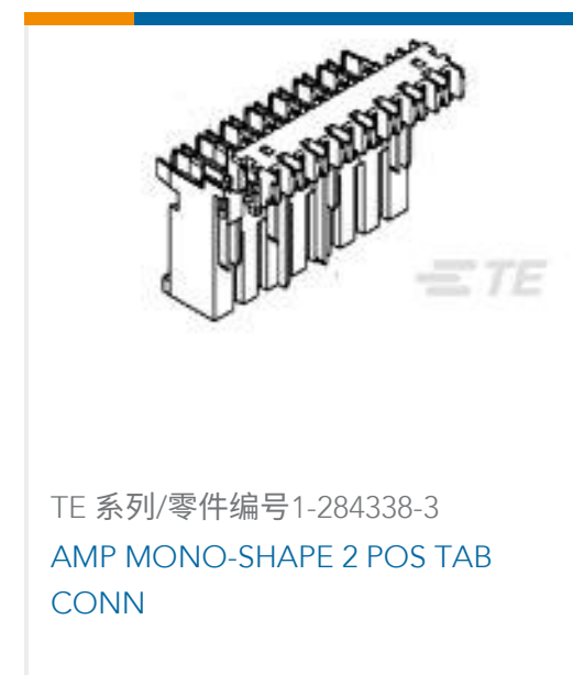
TE 系列/零件编号1-284338-3 AMP MONO-SHAPE 2 POS TAB CONN