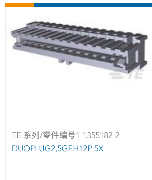
TE 系列/零件编号1-1355182-2 DUOPLUG2,5GEH12P 5X