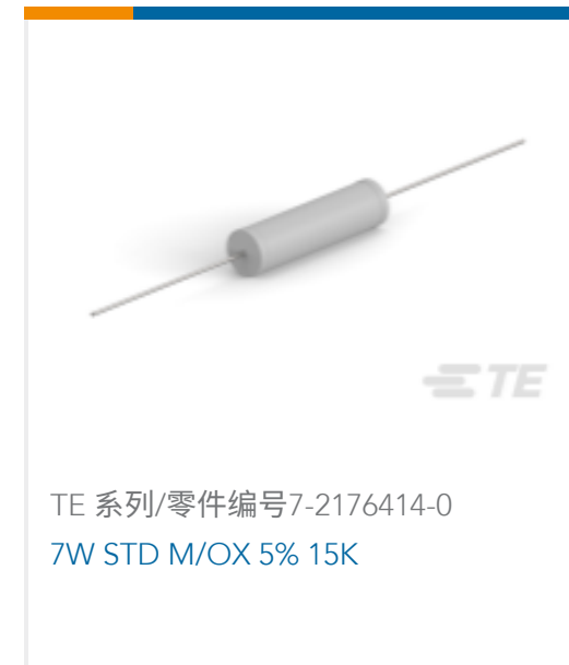
TE 系列/零件编号7-2176414-0 7W STD M/OX 5% 15K