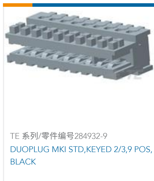
TE 系列/零件编号284932-9 DUOPLUG MKI STD,KEYED 2/3,9 POS, BLACK