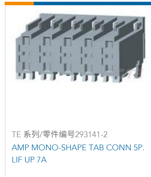
TE 系列/零件编号293141-2 AMP MONO-SHAPE TAB CONN 5P. LIF UP 7A