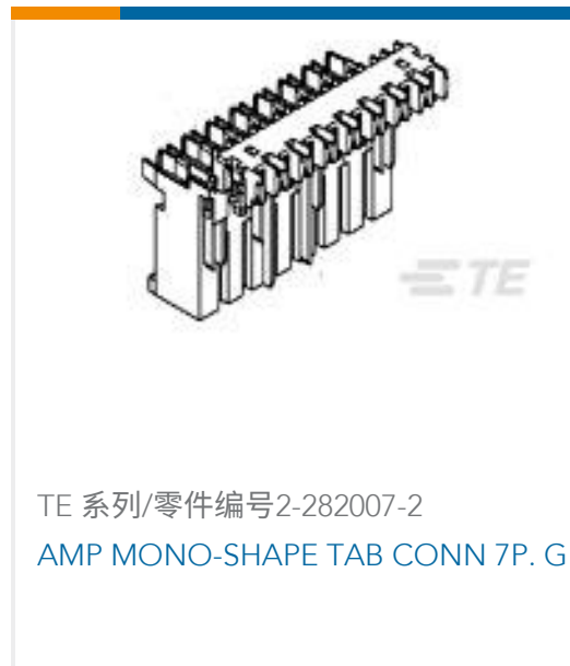
TE 系列/零件编号2-282007-2 AMP MONO-SHAPE TAB CONN 7P. G