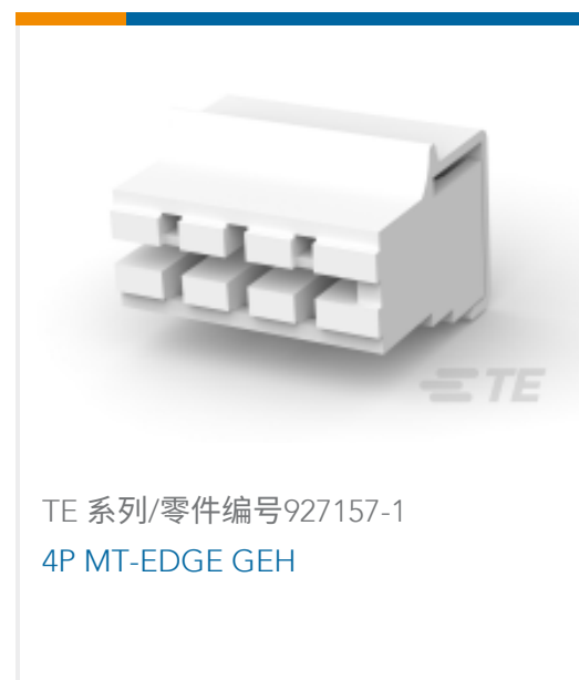
TE 系列/零件编号927157-1 4P MT-EDGE GEH