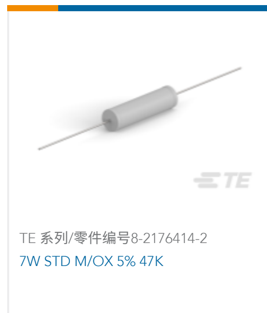
TE 系列/零件编号8-2176414-2 7W STD M/OX 5% 47K