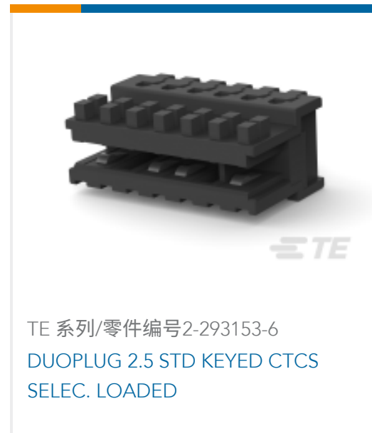
TE 系列/零件编号2-293153-6 DUOPLUG 2.5 STD KEYED CTCS SELEC. LOADED