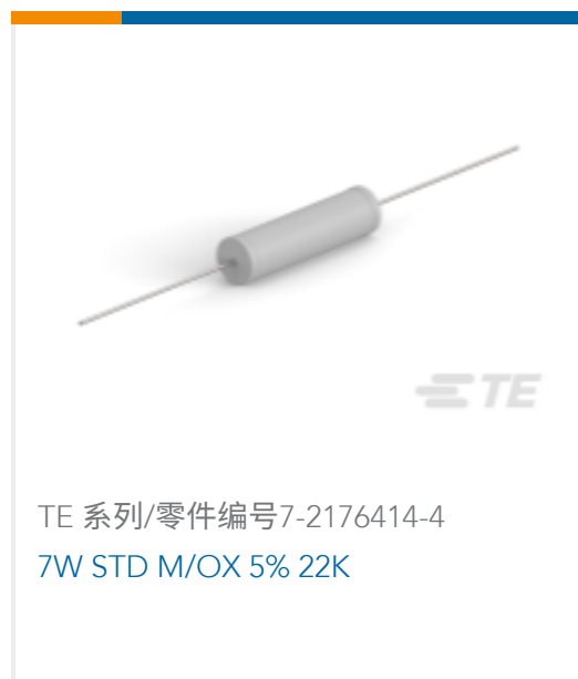
TE 系列/零件编号7-2176414-4 7W STD M/OX 5% 22K