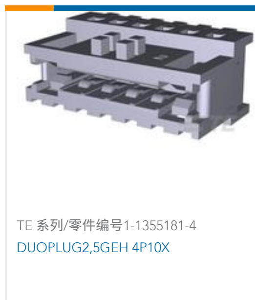
TE 系列/零件编号1-1355181-4 DUOPLUG2,5GEH 4P10X