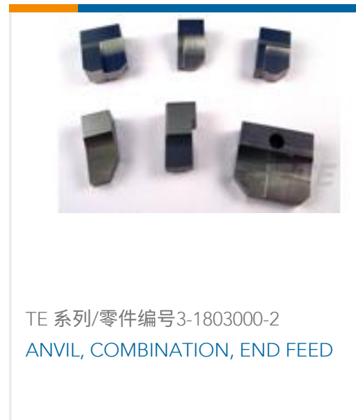
TE 系列/零件编号3-1803000-2 ANVIL, COMBINATION, END FEED