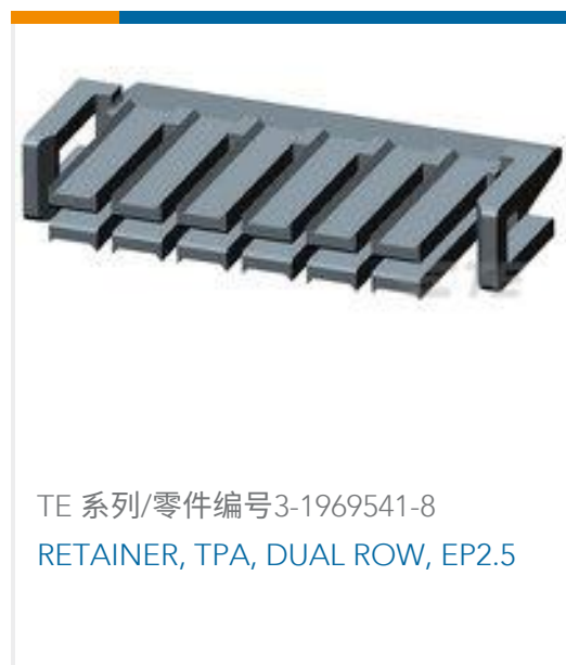
TE 系列/零件编号3-1969541-8 RETAINER, TPA, DUAL ROW, EP2.5