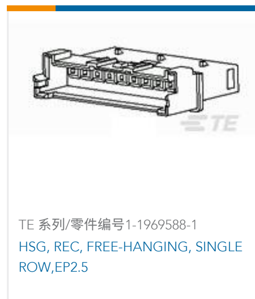
TE 系列/零件编号1-1969588-1 HSG, REC, FREE-HANGING, SINGLE ROW, EP2.5