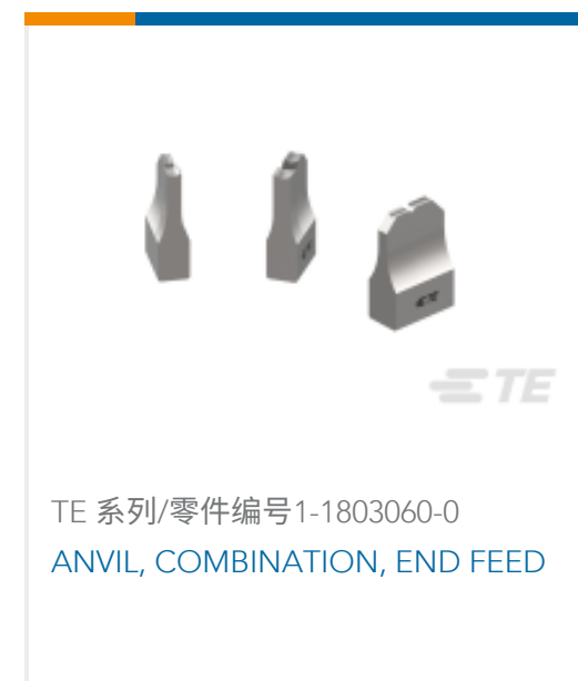
TE 系列/零件编号1-1803060-0 ANVIL, COMBINATION, END FEED