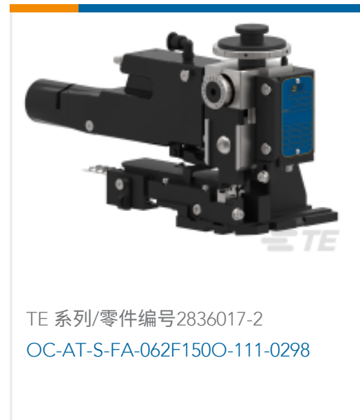
TE 系列/零件编号2836017-2 OC-AT-S-FA-062F150O-111-0298