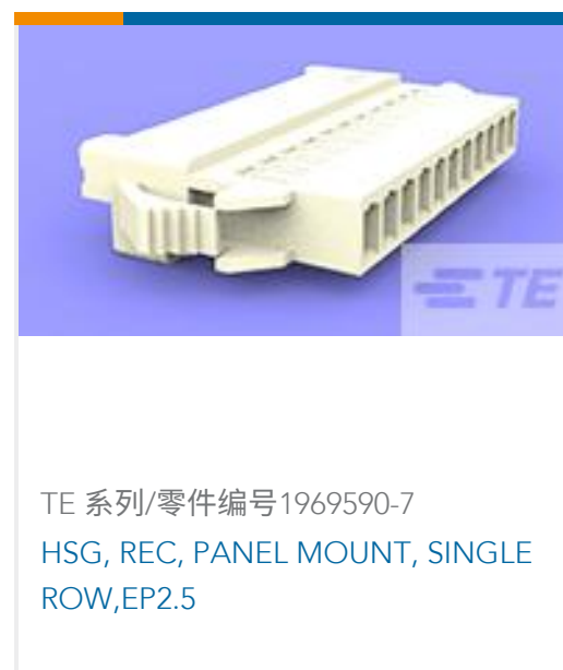
TE 系列/零件编号1969590-7 HSG, REC, PANEL MOUNT, SINGLE ROW, EP2.5