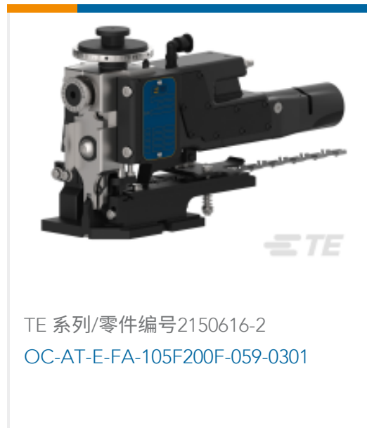
TE 系列/零件编号2150616-2 OC-AT-E-FA-105F200F-059-0301