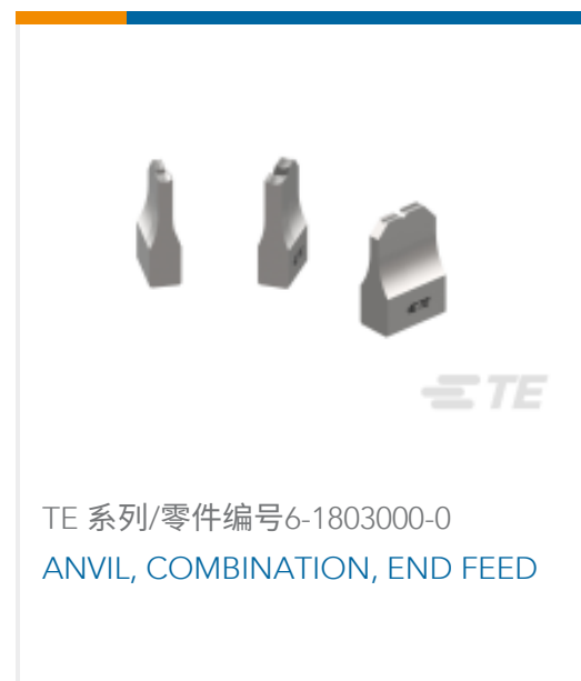
TE 系列/零件编号6-1803000-0 ANVIL, COMBINATION, END FEED