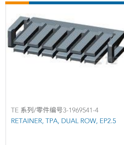
TE 系列/零件编号3-1969541-4 RETAINER, TPA, DUAL ROW, EP2.5