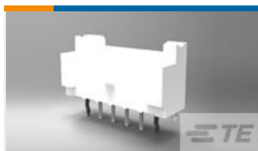
TE 系列/零件编号1744418-2 2 POS EP 2.5 HDR, GLOW WIRE