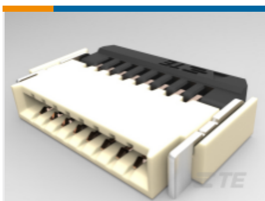
TE 系列/零件编号2328702-6 6PIN 0.5MMP FPC CONNECTOR, BACK FLIP LOCK