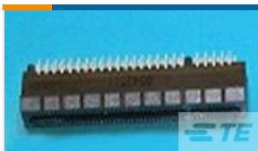
TE 系列/零件编号5650118-3 CONN SEC II 6 POS 100C/L R/A