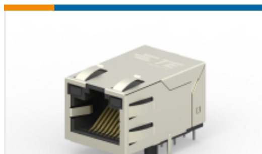
TE 系列/零件编号2301994-2 RJ45 JACK INT.MAG. 10/100 LED 1X1 INV.