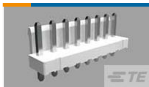
TE 系列/零件编号1744037-3 03P EC PWR.200 CL HDR ASSY VRT