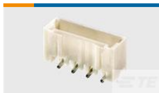
TE 系列/零件编号292231-4 1.5 MINI CT SGL V SMT W/O BOSS