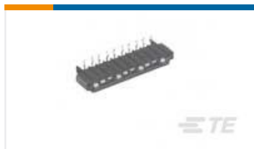
TE 系列/零件编号5-520314-2 TRIOMATE ASSY H 2P L=2.54 LDFR