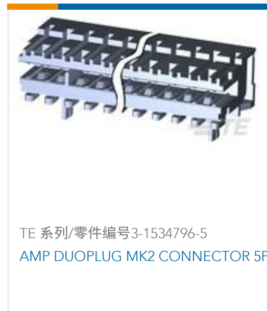
TE 系列/零件编号3-1534796-5 AMP DUOPLUG MK2 CONNECTOR 5P