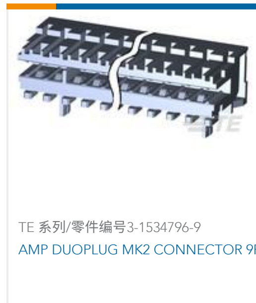
TE 系列/零件编号3-1534796-9 AMP DUOPLUG MK2 CONNECTOR 9P