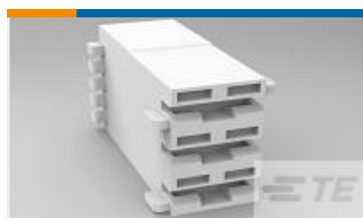
TE 系列/零件编号521205-7 RAST 5, P-L mk3 HSG.-3 POS (sp)