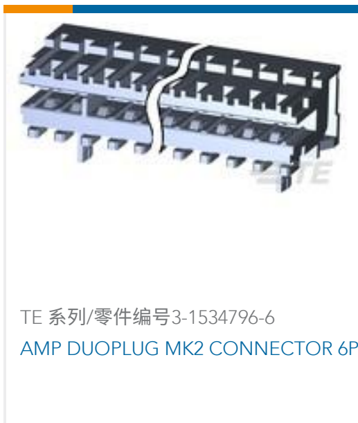
TE 系列/零件编号3-1534796-6 AMP DUOPLUG MK2 CONNECTOR 6P