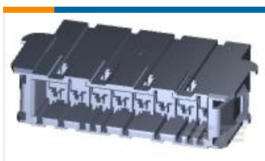
TE 系列/零件编号5-1241967-8 FASTIN FASTON TAB HOUSING 8P