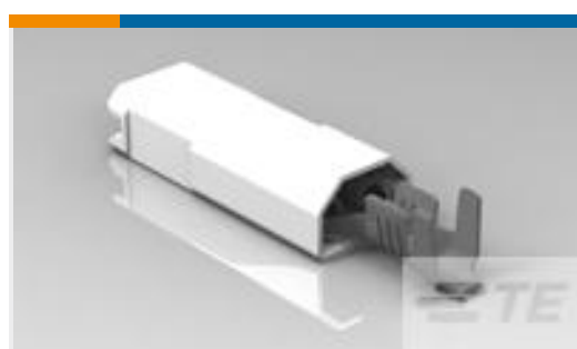
TE 系列/零件编号521225-1 ULTRA-POD 187 ASSY REC 20-16 AWG BR