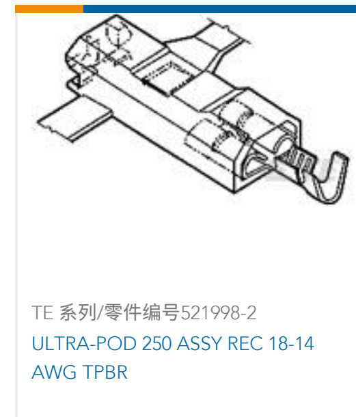
TE 系列/零件编号521998-2 ULTRA-POD 250 ASSY REC 18-14 AWG TPBR