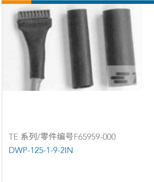
TE 系列/零件编号F65959-000 DWP-125-1-9-2IN