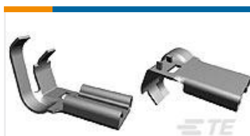
TE 系列/零件编号1742291-1 FASTON 250 RECEPTACLE 16-14 AWG TPPHBZ