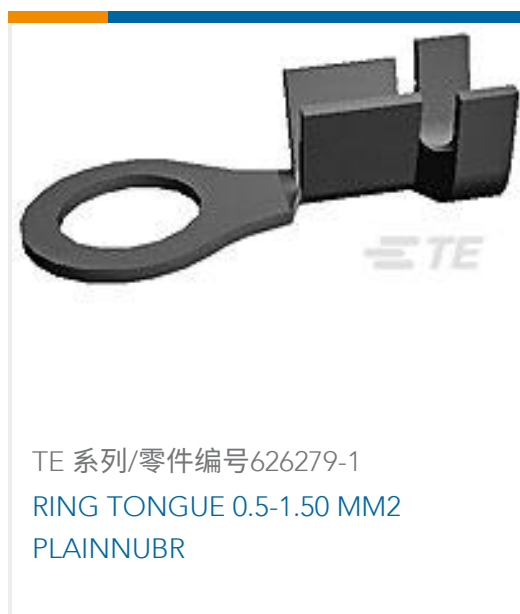
TE 系列/零件编号626279-1 RING TONGUE 0.5-1.50 MM2 PLAINNUBR