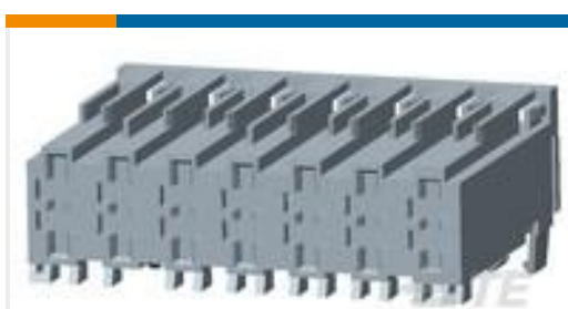
TE 系列/零件编号293143-1 AMP MONO-SHAPE TAB CONN 7P. LIF UP 10A