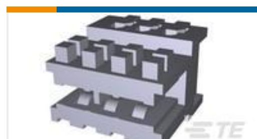
TE 系列/零件编号3-284932-3 DUOPLUG MKI STD, KEYED 2/3, 3 POS., RED