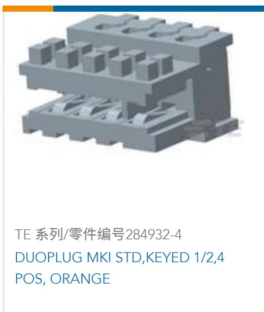
TE 系列/零件编号284932-4 DUOPLUG MKI STD,KEYED 1/2,4 POS, ORANGE