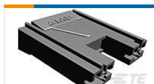
TE 系列/零件编号176498-2 PL MKII 187 REC HSG 2P NYLON BLACK