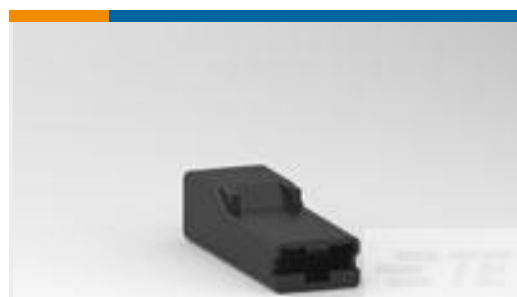
TE 系列/零件编号1-2133394-2 FASTON 187 HOUSING REC BLACK 6.6 PA