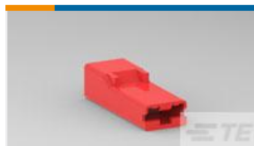
TE 系列/零件编号1-2133394-3 FASTON 187 HOUSING RECEPTACLE RED 6.6 PA