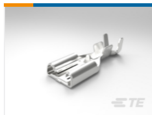
TE 系列/零件编号2238135-2 RECEPTACLE, POSITIVE-LOCK, RAST 6.35