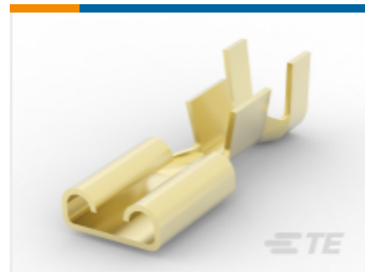
TE 系列/零件编号60214-3 .187 FAST REC 20-16 .0126BR