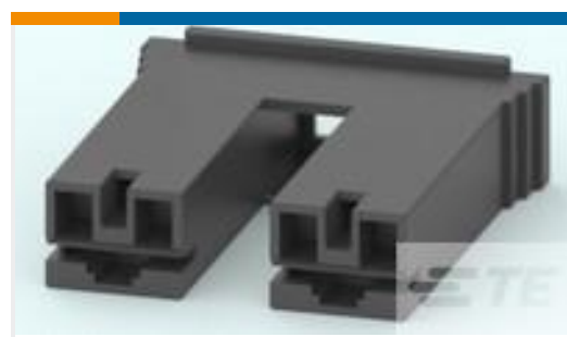
TE 系列/零件编号1-520935-8 PL 250 HOUSING RECEPTACLE