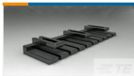
TE 系列/零件编号1-1969443-1 EP 2.5 TPA Retainer, 11 Pos