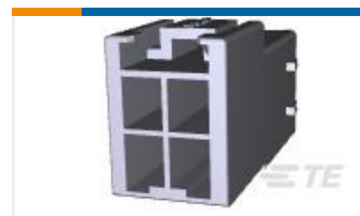
TE 系列/零件编号368587-1 PDL 4P CAP 3.96 D/R F/H(GWT) N