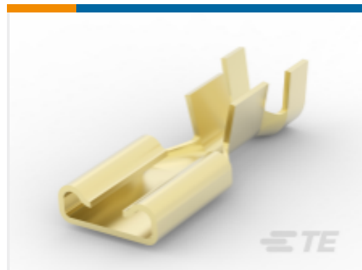
TE 系列/零件编号60196-8 .187 FAST REC 20-16 BR