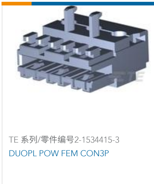
TE 系列/零件编号2-1534415-3 DUOPL POW FEM CON3P