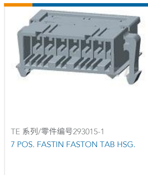
TE 系列/零件编号293015-1 7 POS. FASTIN FASTON TAB HSG.