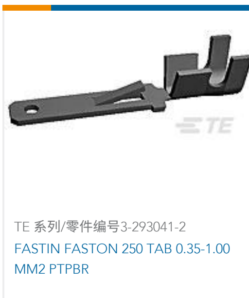
TE 系列/零件编号3-293041-2 FASTIN FASTON 250 TAB 0.35-1.00 MM2 PTPBR