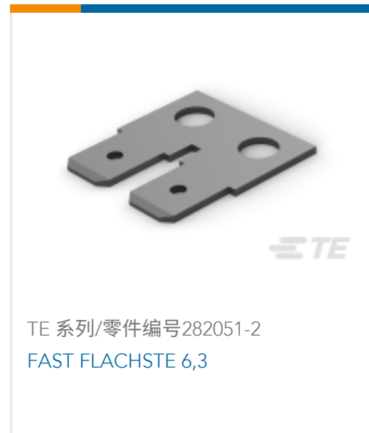
TE 系列/零件编号282051-2 FAST FLACHSTE 6,3