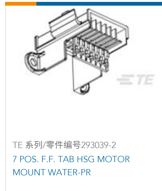
TE 系列/零件编号293039-2 7 POS. F.F. TAB HSG MOTOR MOUNT WATER-PR