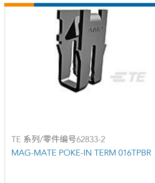
TE 系列/零件编号62833-2 MAG-MATE POKE-IN TERM 016TPBR