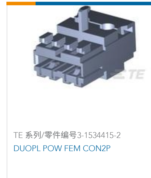
TE 系列/零件编号3-1534415-2 DUOPL POW FEM CON2P