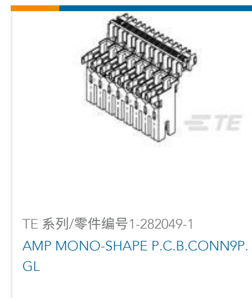
TE 系列/零件编号1-282049-1 AMP MONO-SHAPE P.C.B.CONN9P. GL