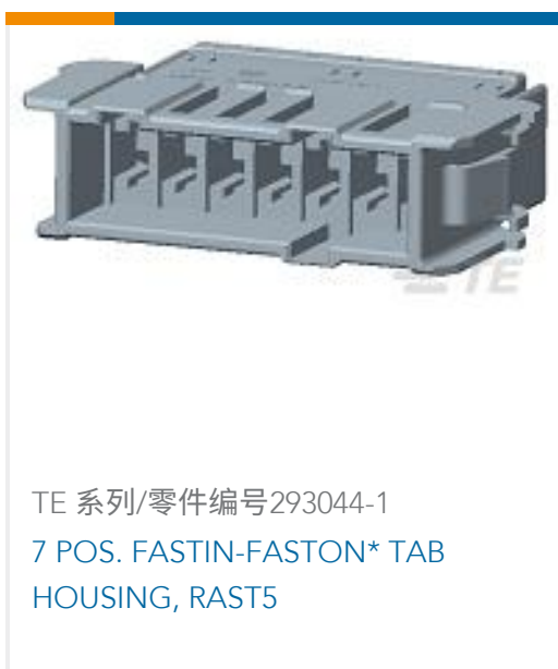
TE 系列/零件编号293044-1 7 POS. FASTIN-FASTON* TAB HOUSING, RAST5