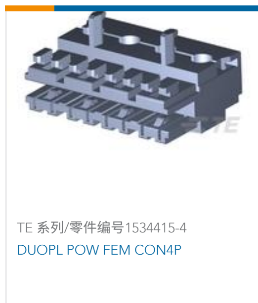
TE 系列/零件编号1534415-4 DUOPL POW FEM CON4P