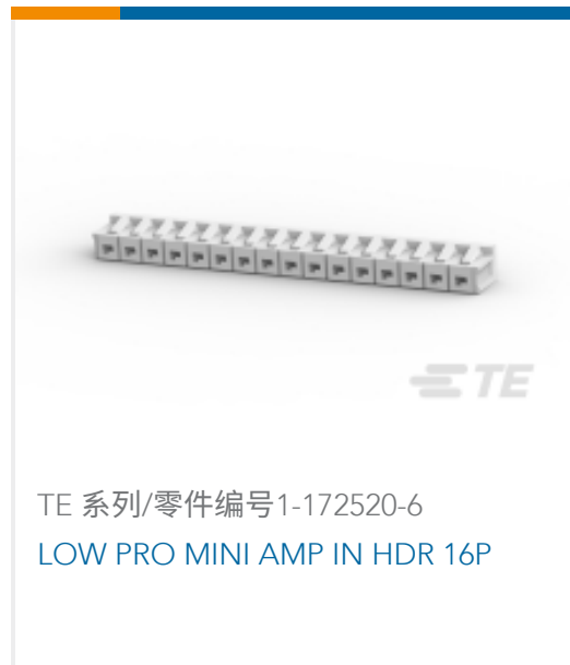
TE 系列/零件编号1-172520-6 LOW PRO MINI AMP IN HDR 16P