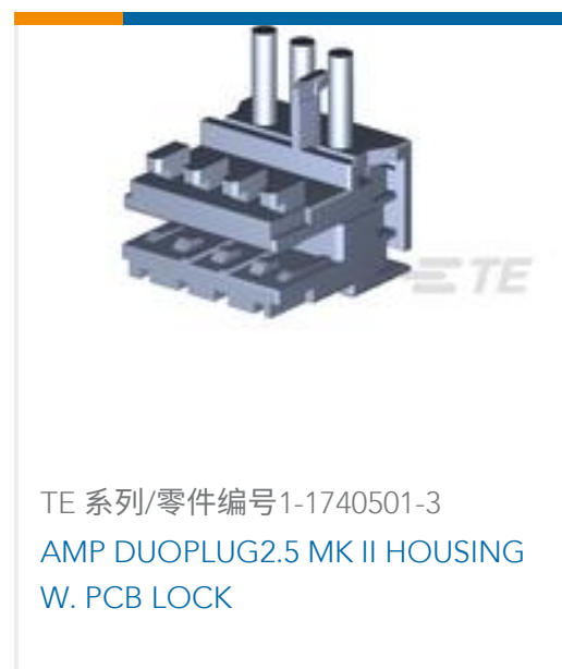
TE 系列/零件编号1-1740501-3 AMP DUOPLUG.2.5 MK II HOUSING W. PCB LOCK