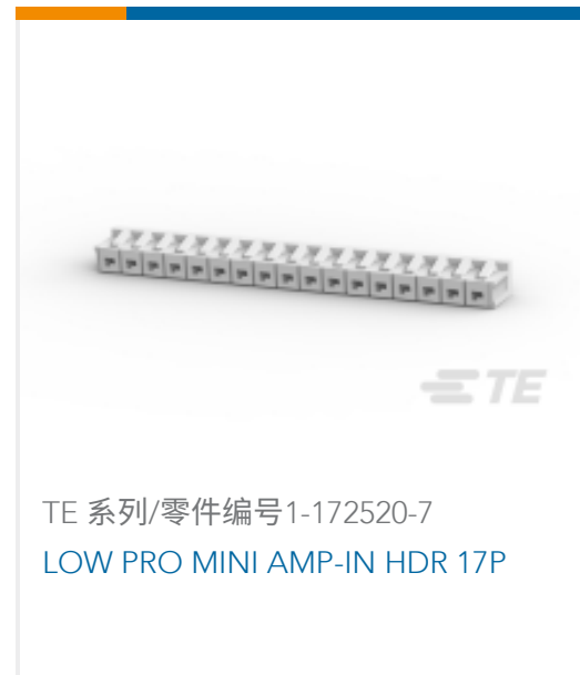
TE 系列/零件编号1-172520-7 LOW PRO MINI AMP-IN HDR 17P