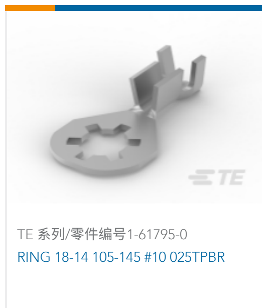
TE 系列/零件编号1-61795-0 RING 18-14 105-145 #10 025TPBR