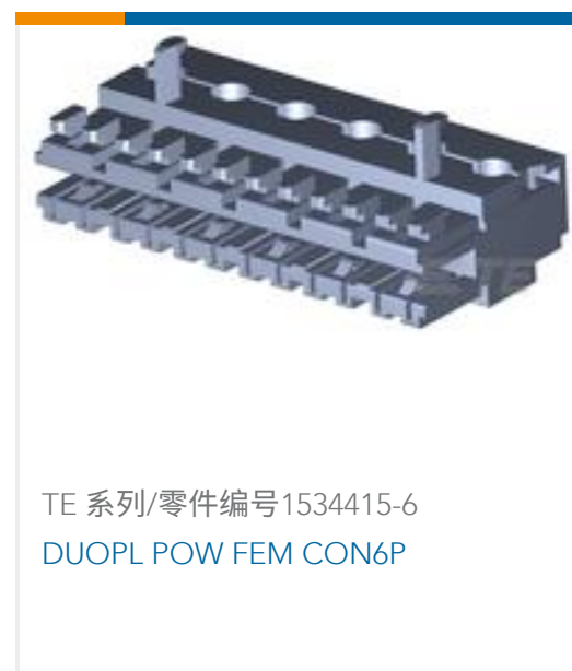
TE 系列/零件编号1534415-6 DUOPL POW FEM CON6P