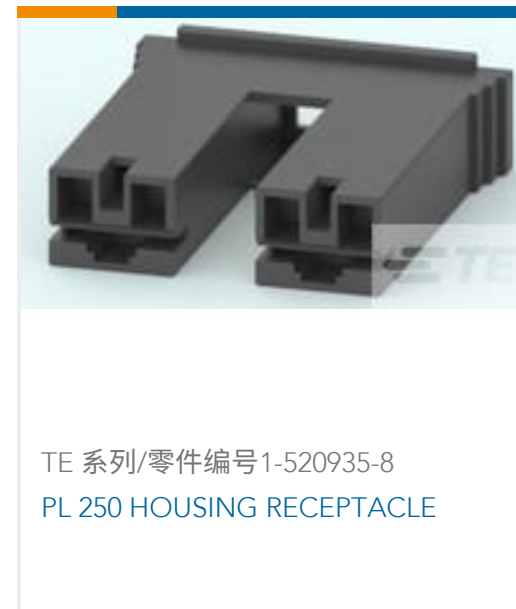
TE 系列/零件编号1-520935-8 PL 250 HOUSING RECEPTACLE