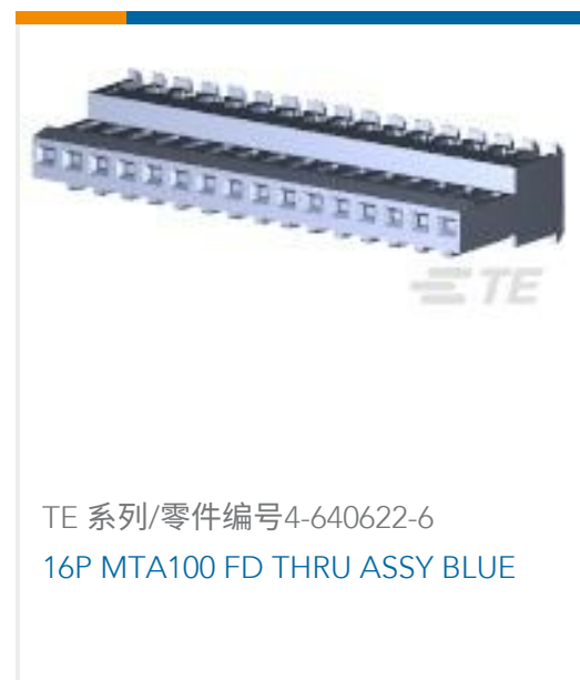
TE 系列/零件编号4-640622-6 16P MTA100 FD THRU ASSY BLUE