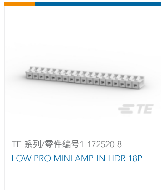
TE 系列/零件编号1-172520-8 LOW PRO MINI AMP-IN HDR 18P