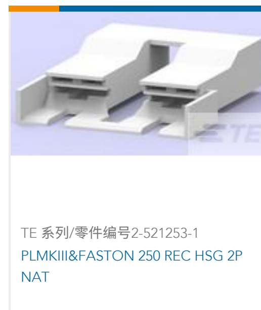
TE 系列/零件编号2-521253-1 PLMKIII&FASTON 250 REC HSG 2P NAT