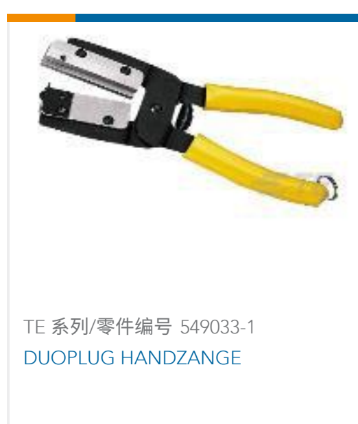
TE 系列/零件编号 549033-1 DUOPLUG HANDZANGE