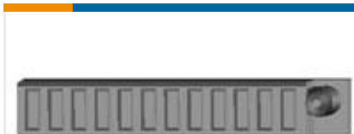
TE 系列/零件编号4-6450540-5 MBXL VERT RCPT 12HDP