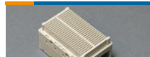
TE 系列/零件编号1-1761615-1 STEP-Z RCPT 11MM 200P PB ST