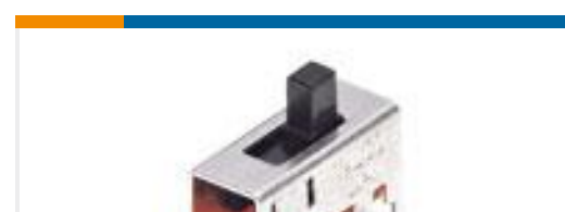
TE 系列/零件编号1825290-2 MHS223RA04=DPDT SL SW R/A AG