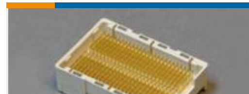
TE 系列/零件编号1-1761612-0 STEP-Z PLUG 10MM 104P PB ST