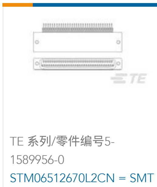
TE 系列/零件编号5- 1589956-0 STM06512670L2CN = SMT Conn