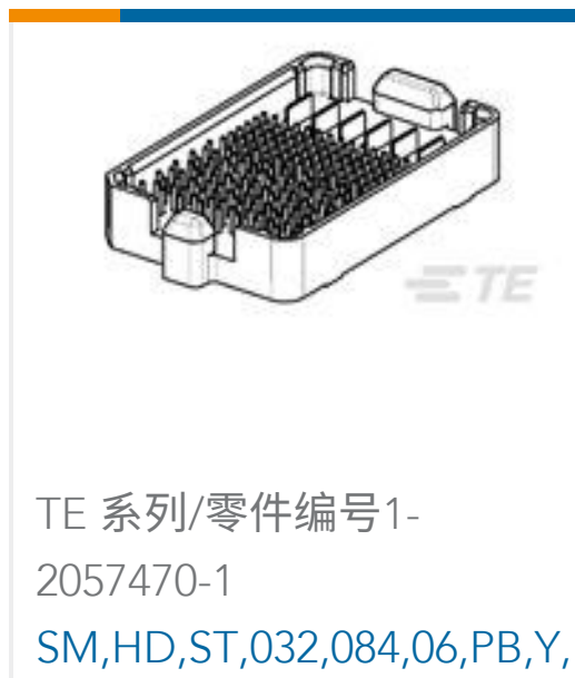
TE 系列/零件编号1- 2057470-1 SM,HD,ST,032,084,06,PB,Y, 11