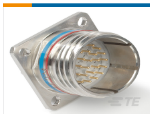
TE 系列/零件编号 YACT20JJ35SEV00100 SQUARE FLANGE RECEPTACLE