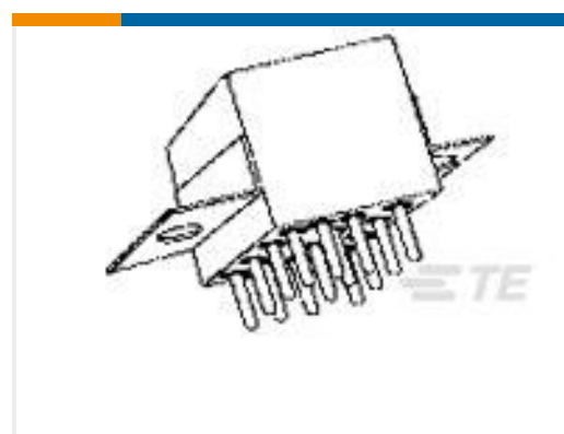
TE 系列/零件编号7- 1617760-3 FCB-405-0612L=M83536/6- 012L