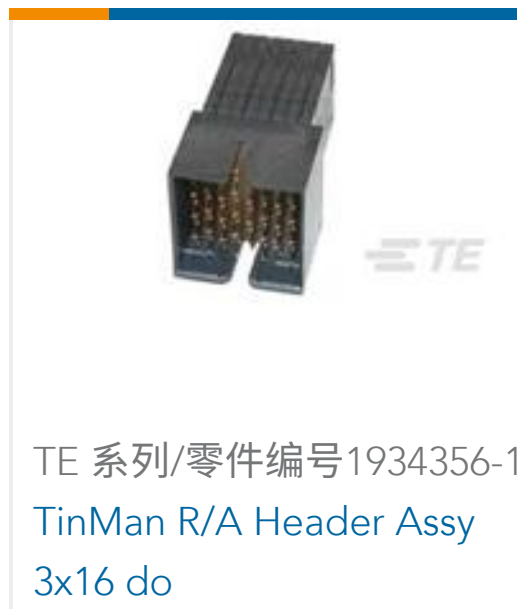
TE 系列/零件编号1934356-1 TinMan R/A Header Assy 3x16 do