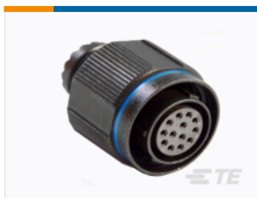
TE 系列/零件编号 YACT26JJ37JNV00100 STRAIGHT PLUG