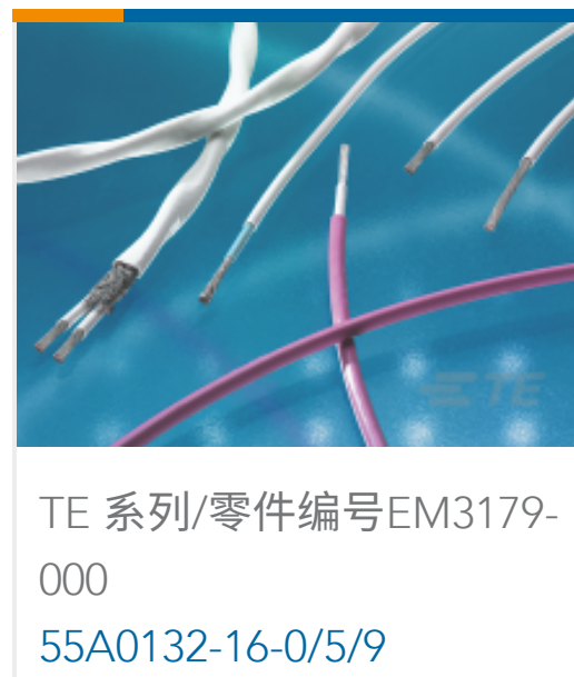
TE 系列/零件编号EM3179- 000 55A0132-16-0/5/9