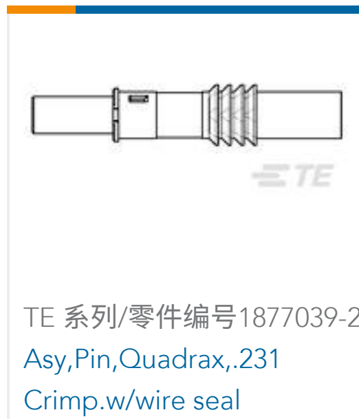
TE 系列/零件编号1877039-2 Asy,Pin,Quadrax,.231 Crimp.w/wire seal