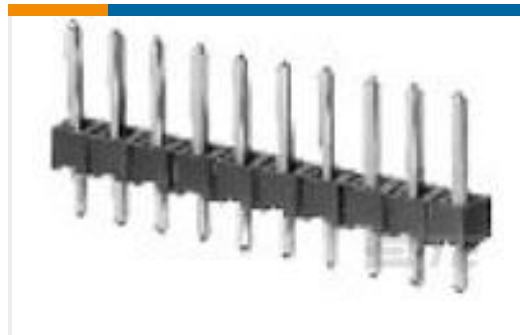
TE 系列/零件编号5-146280-2 02 MODII HDR SRST B/A .100CL