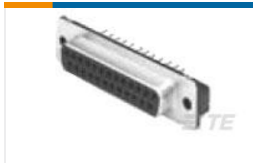
TE 系列/零件编号1-5747150-4 09 RCPT SP/FMS SCRLK