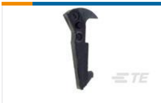
TE 系列/零件编号102320-1 UNIVERSAL HEADER LATCH