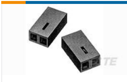
TE 系列/零件编号530153-2 TDM SPRING SHUNT ASSY 2 POS