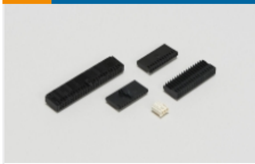
线对板连接器壳体(13)