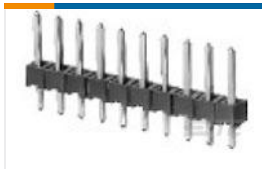
TE 系列/零件编号5-146280-3 03 MODII HDR SRST B/A .100CL