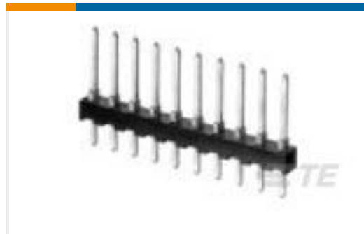
TE 系列/零件编号87224-3 03 MODII HDR SRST UNSHRD .100