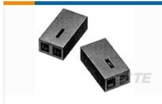
TE 系列/零件编号390088-1 BLACK HSG WITH 30AU CONTACT