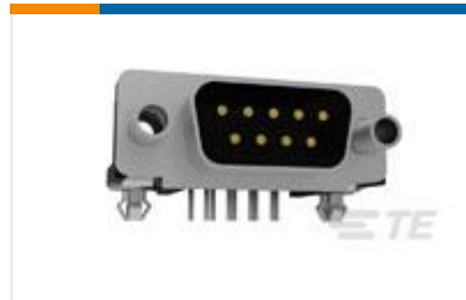
TE 系列/零件编号5747844-6 09 MSFL RCPT RA 318 (SL, FM, BL)