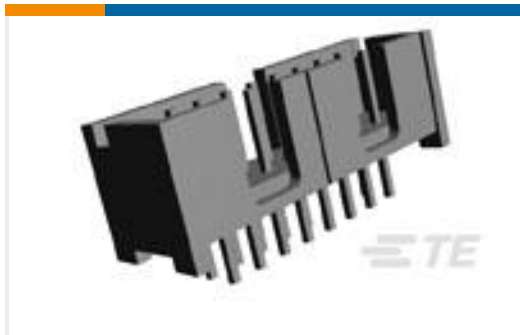
TE 系列/零件编号103308-1 010 LOPRO HDR SP 15DP