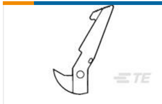
TE 系列/零件编号102312-1 UNIVERSAL HEADER LATCH