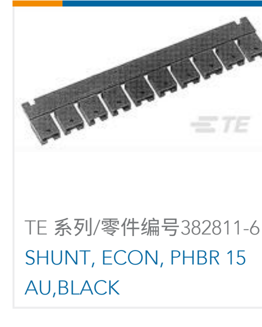
TE 系列/零件编号382811-6 SHUNT, ECON, PHBR 15 AU, BLACK