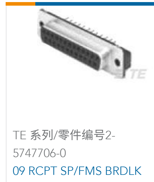
TE 系列/零件编号2-5747706-0 09 RCPT SP/FMS BRDLK