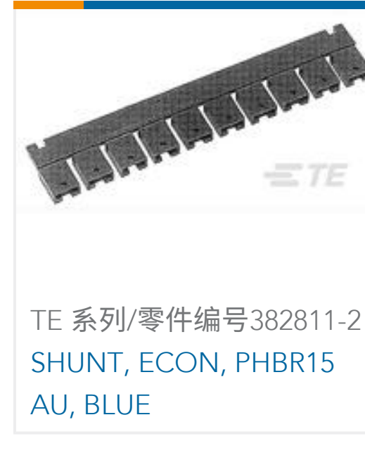
TE 系列/零件编号382811-2 SHUNT, ECON, PHBR15 AU, BLUE