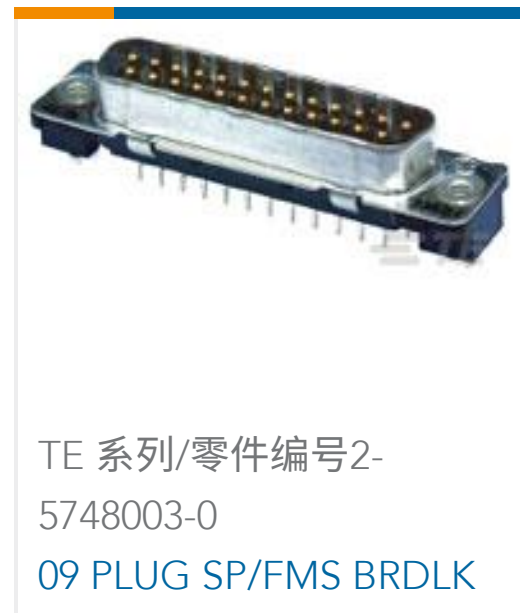
TE 系列/零件编号2-5748003-0 09 PLUG SP/FMS BRDLK