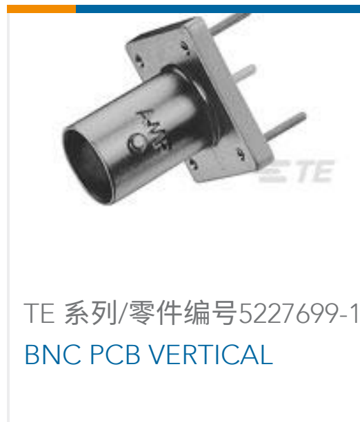
TE 系列/零件编号5227699-1 BNC PCB VERTICAL