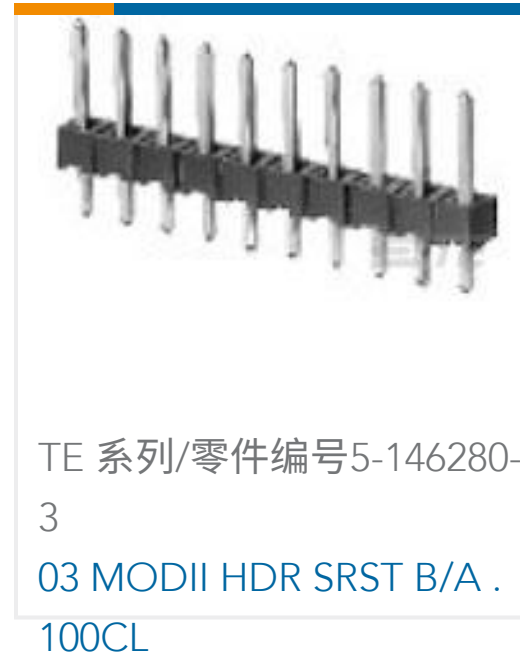
TE 系列/零件编号5-146280-3 03 MODII HDR SRST B/A . 100CL