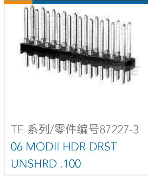
TE 系列/零件编号87227-3 06 MODII HDR DRST UNSHRD .100