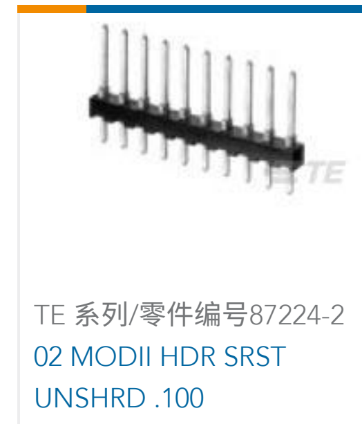
TE 系列/零件编号87224-2 02 MODII HDR SRST UNSHRD .100