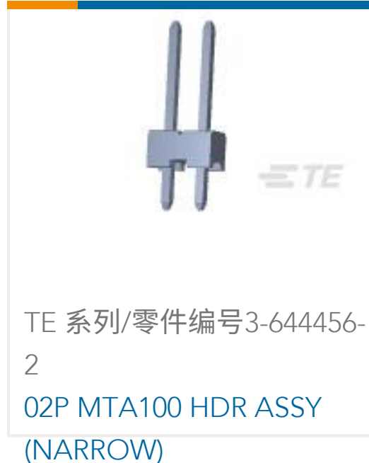
TE 系列/零件编号3-644456-2 02P MTA100 HDR ASSY (NARROW)