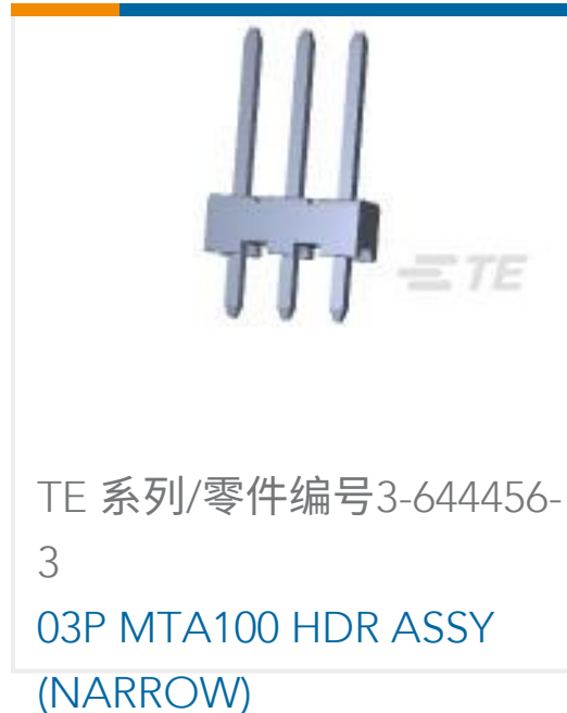
TE 系列/零件编号3-644456-3 03P MTA100 HDR ASSY (NARROW)