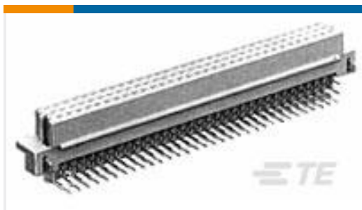
TE 系列/零件编号5650874-5 ASSY,RECEPTACLE, EUROCARD,TYPE