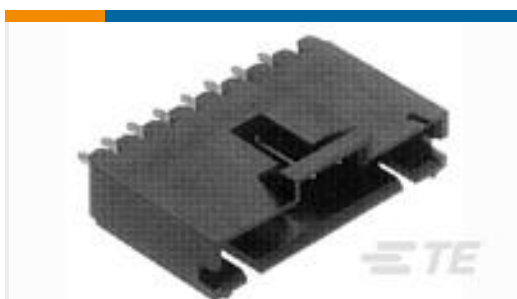
TE 系列/零件编号6-103639-4 15 MTE HDR SRST LATCH . 100CL