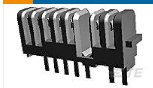
TE 系列/零件编号1747786-1 PACKING,REC. ASSY. 8POS. 2MM PITCH BATTE