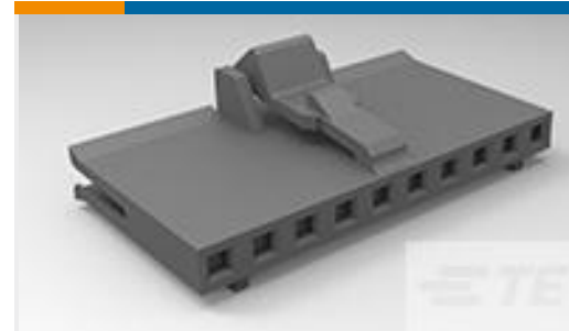
TE 系列/零件编号487526-8 009 HOUSING FFC RCPT 100CL SR