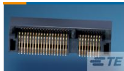
TE 系列/零件编号1759503-1 mini PCI-E 8H Type I PKG G/F