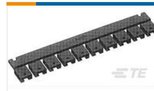
TE 系列/零件编号531230-2 SHUNT, .200 C/L, LP, 2 POS, 15AU