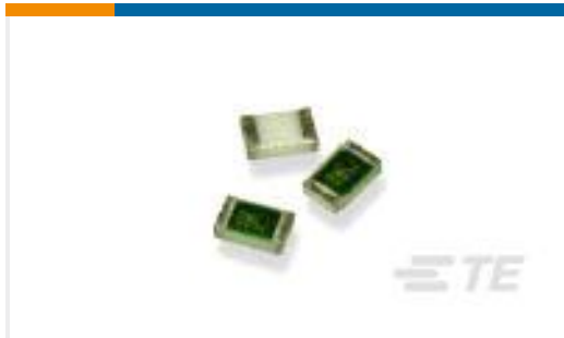
TE 系列/零件编号1-1614959-4 CPF0805 2M0 0.1% 25PPM 1K RL