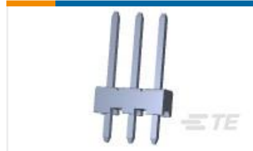
TE 系列/零件编号3-644456-3 03P MTA100 HDR ASSY (NARROW)