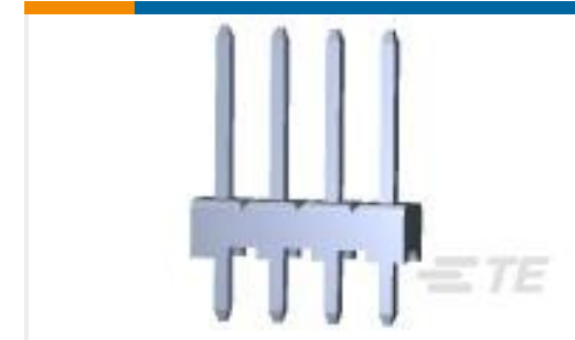
TE 系列/零件编号3-644456-4 04P MTA100 HDR ASSY (NARROW)