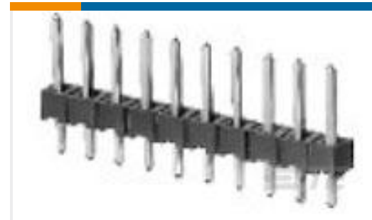
TE 系列/零件编号5-146280-3 03 MODII HDR SRST B/A . 100CL