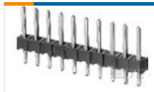
TE 系列/零件编号5-146280-2 02 MODII HDR SRST B/A . 100CL