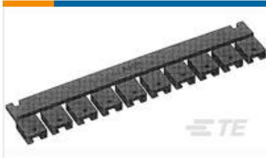
TE 系列/零件编号531230-3 SHUNT, .200 C/L, LP, 2 POS 30AU