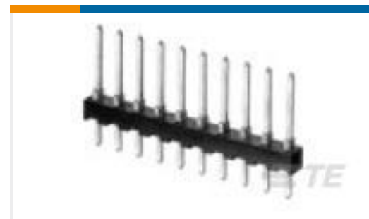
TE 系列/零件编号87224-3 03 MODII HDR SRST UNSHRD .100