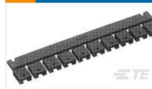
TE 系列/零件编号531230-4 SHUNT,.200 C/L, 2 POS, SN