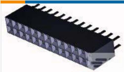
TE 系列/零件编号6-534206-3 26 MODII VRT DR CE 100 /115