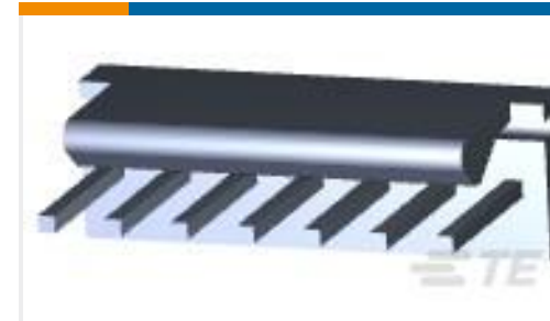
TE 系列/零件编号3-641126-7 07P MTA100 HDR ASY FL /STR LF