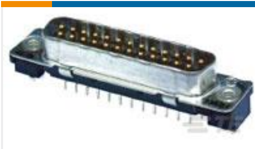
TE 系列/零件编号5748027-1 25 PLUG SP/FMS (IN,SL)