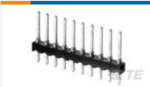
TE 系列/零件编号87220-8 08 MODII HDR SRST UNSHRD .100