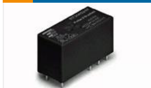
TE 系列/零件编号3-1419108-1 RTD14024F