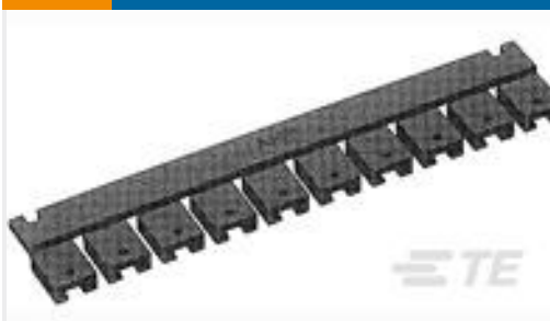
TE 系列/零件编号531230-2 SHUNT,.200 C/L,LP,2 POS, 15AU