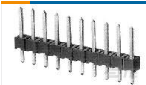
TE 系列/零件编号103185-3 03 MODII HDR SRST B/A .100CL