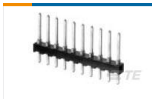
TE 系列/零件编号87220-2 02 MODII HDR SRST UNSHRD .100