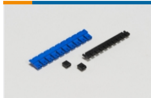
板对板跳线和分路(7)