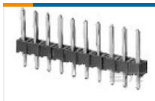
TE 系列/零件编号5-146280- 2 02 MODII HDR SRST B/A . 100CL