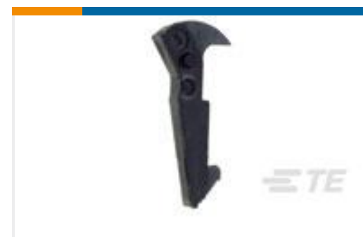
TE 系列/零件编号102320-1 UNIVERSAL HEADER LATCH