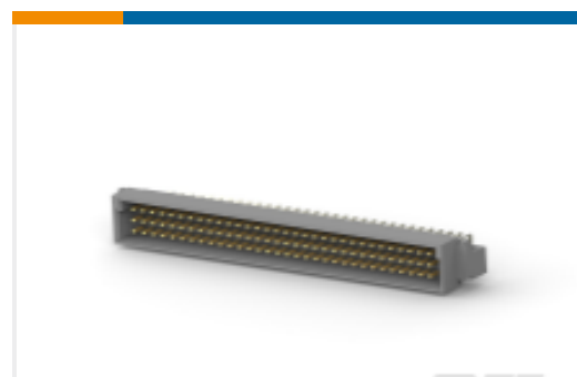
TE 系列/零件编号650473-5 096 EURO TYPE C PIN ST ASSY