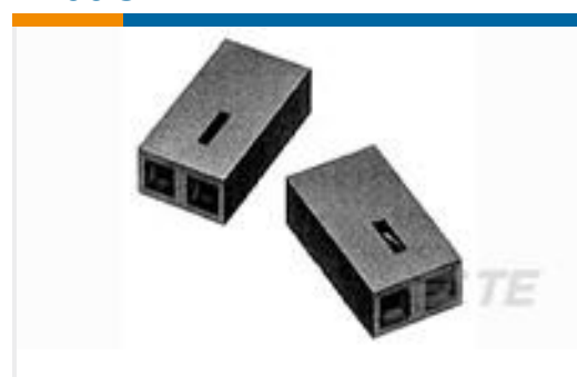
TE 系列/零件编号390088-2 BLACK HSG WITH 15AU CONTACT