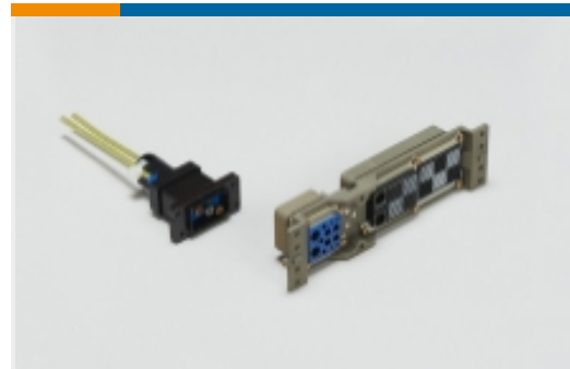
机架和配线架连接器(1)