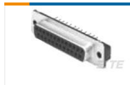
TE 系列/零件编号2- 5747708-0 25 RCPT SP/FMS BRDLK