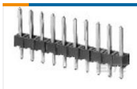
TE 系列/零件编号5-146280- 3 03 MODII HDR SRST B/A . 100CL