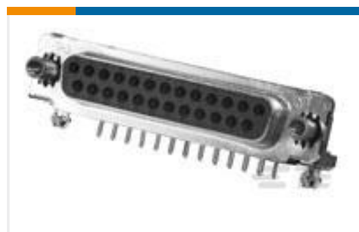
TE 系列/零件编号5747845-4 15 MSFL RCPT RA 318 (IN, FM,BL)