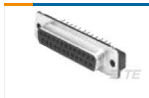
TE 系列/零件编号1- 5747150-4 09 RCPT SP/FMS SCRLK