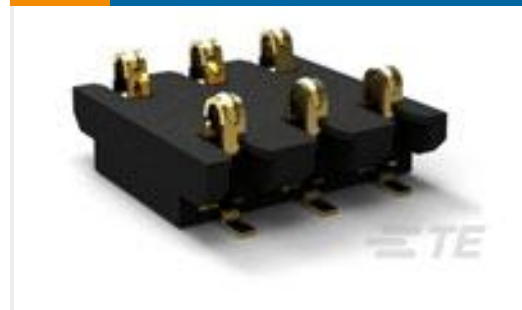
TE 系列/零件编号1932771-1 6 pins 1.6P 1.65H BtoB connector