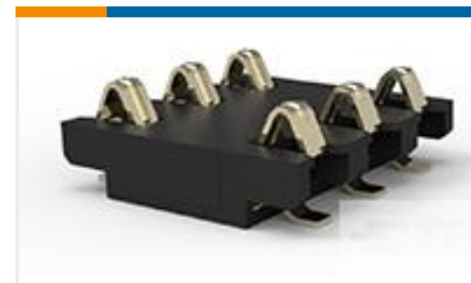
TE 系列/零件编号2199170-1 6 pins 1.6P 1.4H BtoB connector