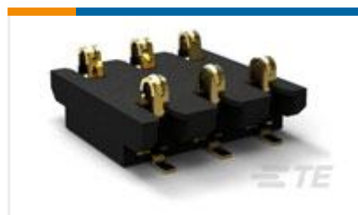
TE 系列/零件编号 1932771-1 6 pins 1.6P 1.65H BtoB connector