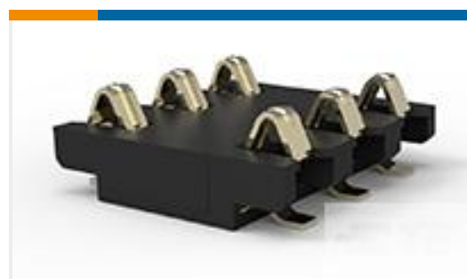
TE 系列/零件编号 2199170-1 6 pins 1.6P 1.4H BtoB connector