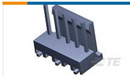
TE 系列/零件编号3-647502-4 04P MTA100 HDR ASSY, SM,SN, LF