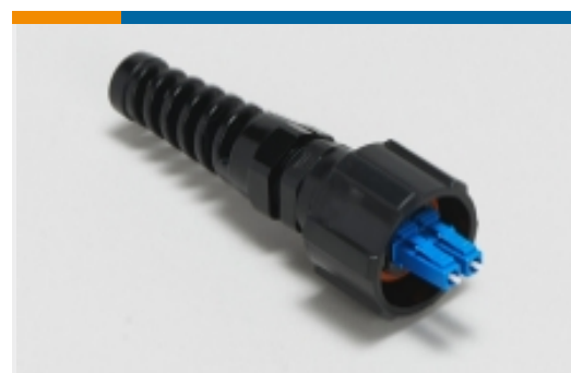
ODVA LC 连接器(3)