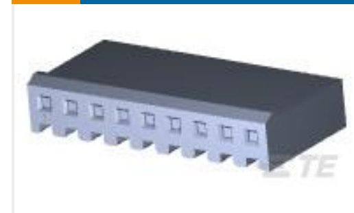
TE 系列/零件编号647401-9 09P SL156 HSG W/RAMP, LRG OPEN