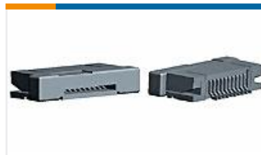
TE 系列/零件编号1-1734592-1 FPC CONN. 0.5MM PITCH B/C, 11P