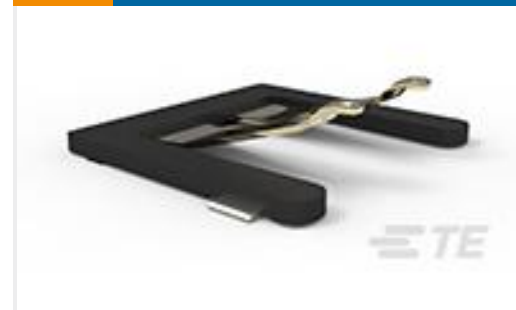
TE 系列/零件编号2246092-2 2pos compressive BtB conn