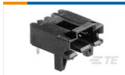
TE 系列/零件编号6-103673-6 17 MTE HDR SRRA LATCH W/HLDWN