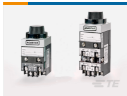
TE 系列/零件编号4-1437453-3 7022BH=RLY,STD,OFF,2P, 240VAC,