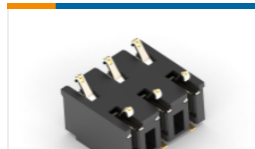
TE 系列/零件编号 2199064-2 TAP 6 POS 2.0PITCH 3.15H