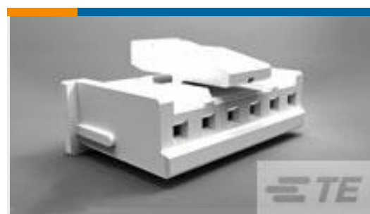
TE 系列/零件编号 1-1744417-2 12 POS EP 2.5 HSG, GLOW WIRE