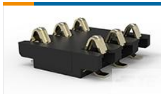
TE 系列/零件编号 2199170-1 6 pins 1.6P 1.4H BtoB connector