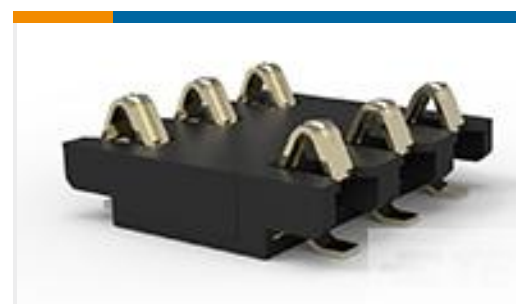
TE 系列/零件编号 2199170-1 6 pins 1.6P 1.4H BtoB connector