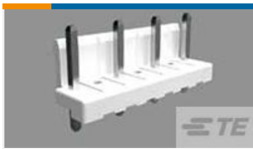
TE 系列/零件编号7-1123724-5 3.96EP HDR ASSY 5(9)P NATURAL