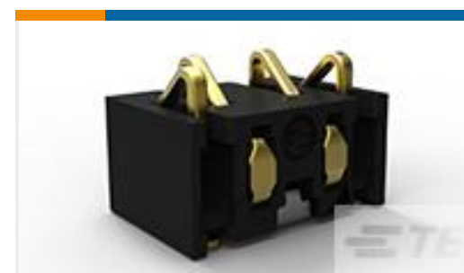
TE 系列/零件编号 2199064-2 TAP 6 POS 2.0PITCH 3.15H