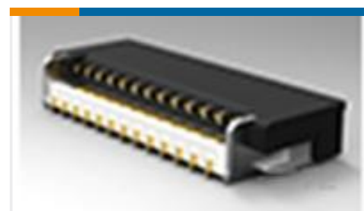
TE 系列/零件编号 2-2040832-1 EMBOSS TAPING 0.25FPC BF-L-1.3