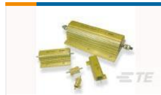
TE 系列/零件编号3-1630186-4 HSA50 R047 5%